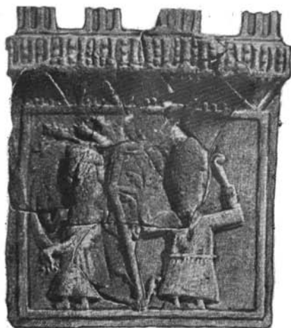
Abb. 2. ábra. Alakos kályhacsempe Kevermesről. II. (XVI. sz.)

A csempeken sok helyen élesen vágódó formákat figyelhetünk meg. Ezek a formák érzékenyen követik, s így tükrözik is a fanegatív megmunkálását. Ha agyagnegatívot tételeznénk fel, amit fapozitívról vettek le, akkor ezeket az élesen vágódó formákat nem látnánk. Az agyagpozitívból kikerülő minta egyik formája elmosódottabb éllel megy át a másikba, mint a közvetlenül fából készült préselőminták termékeinél. Utóbbinál még megfigyelhetjük a faragási technikát, míg az előzőnél elvesznek a közvetlenül fára utaló nyomok. Csempeinken néhány helyen kivehető a negatívban használt fa erezésének nyoma is; főleg az egyik csempe pártázatának középső részén láthatjuk az egymással párhuzamosan futó rostok lenyomatát (2. ábra). A kevermesi és a teljesen azonos