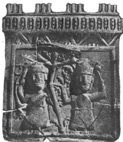
Abb. 1. ábra. Alakos kályhacsempé Kékesről. I. (XVI. sz.)

bele az általunk tárgyalt kályhacsempék sorába. Valószínű állati karom stilizált ábrázolása van a kis töredéken (I. t. 8.). A mérműves csempetöredékek kiesnek vizsgálódási területünkől, ezeket a kevermesi teljes leletanyag feldolgozásakor mutatom be.