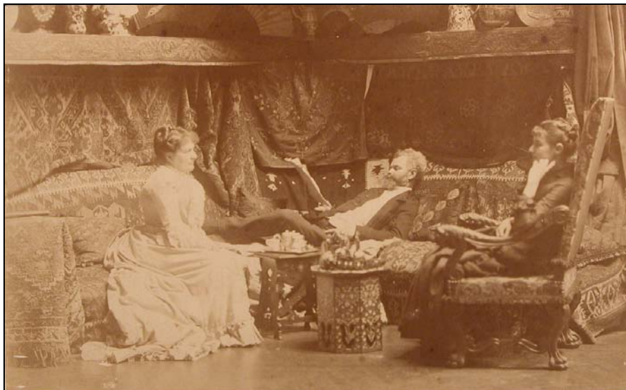
2. kép. Keleti sátrában egy vendéggel. MMM TörtGyűjt Itsz.: Hd 58.26.9