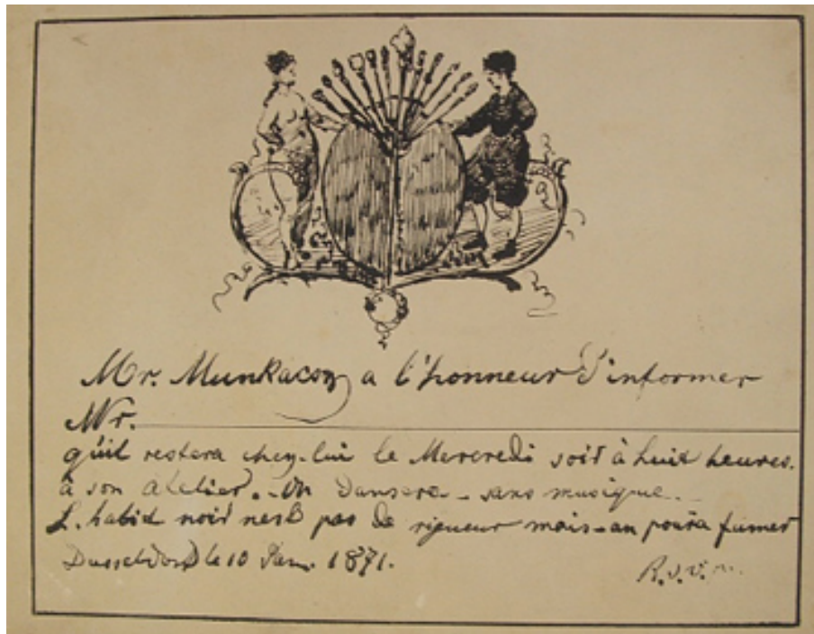
1. kép. Düsseldorf-i meghívó. MMM TörtGyűjt Itsz.: Hd 58.5574.1