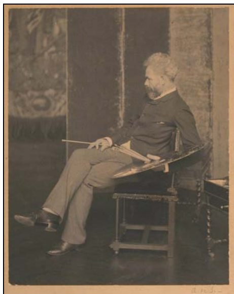
3. kép. Munkácsy festőpalettával. MMM TörtGyűjt ltsz.: Hd 58.26.15