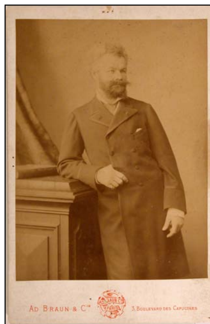
5. kép. Munkácsy az 1880-as években. Braun, Párizs. MMM TörtGyűjt ltsz.: Hd 58.26.20