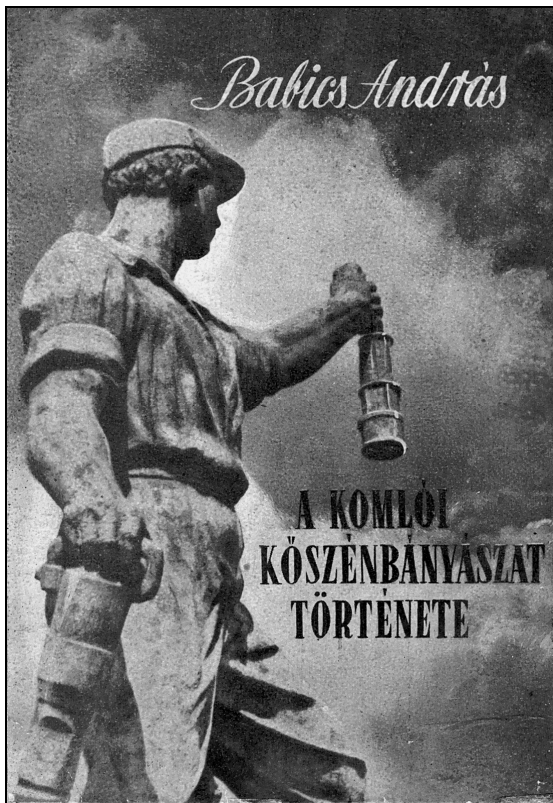
A komlói szénbányászat történetét feldolgozó könyv címlapja.

1952-től új történészekkel bővült az intézet, akiknek szakmai indulását határozott követelményrendszerrel, de emberi közvetlenséggel segítette. Később, mint aspiránsvezető és opponens a szigorú kritikus mellett megértő ember is tudott lenni kollégáival.