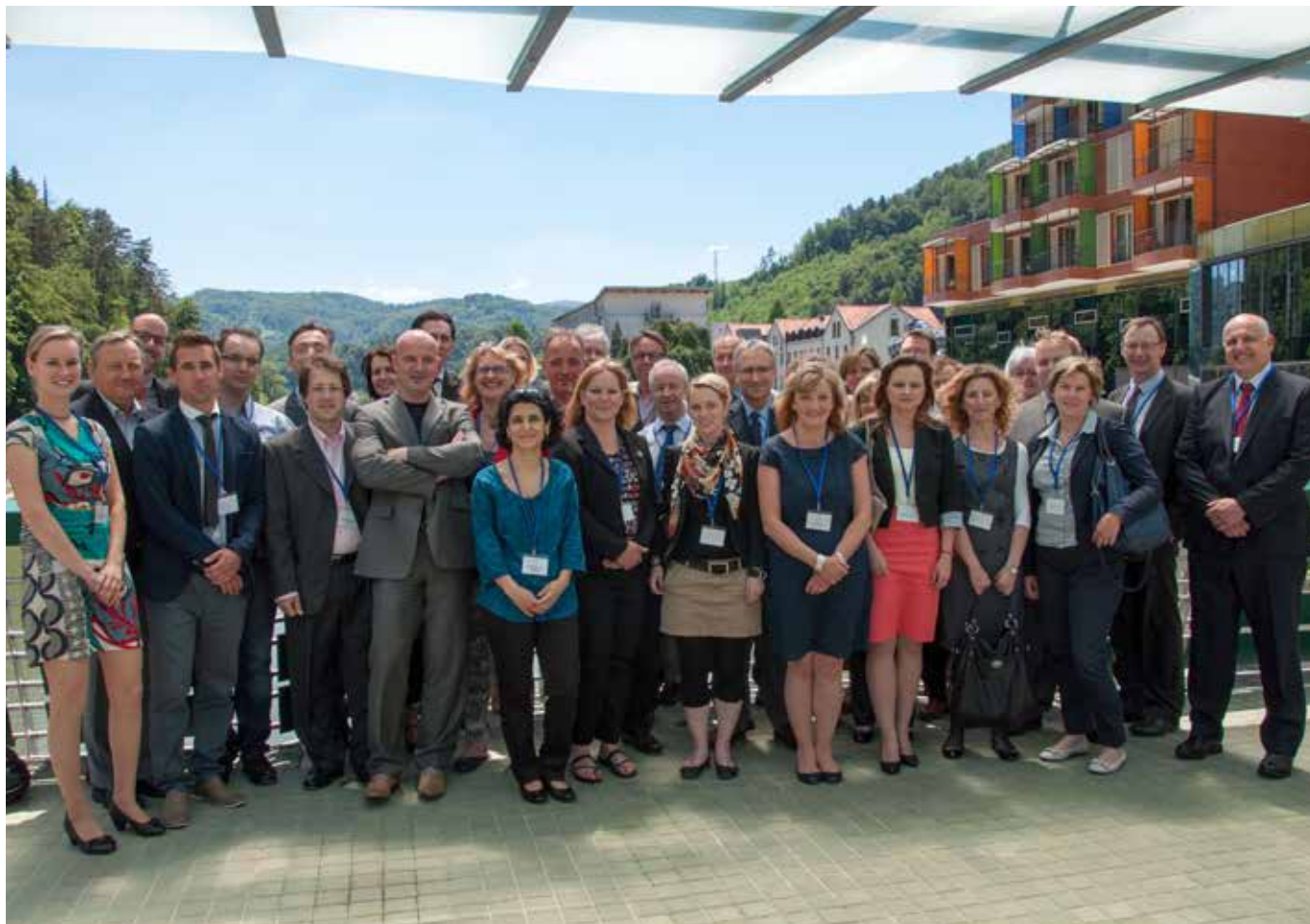
▶ Az IQ-Net tagjai összegyűjtésükön a hálózat fennállásának 20. évfordulóját ünneplik

A STRUKTURÁLIS ALAPOKKAL KAPCSOLATOS TAPASZTALATCSERE 20. ÉVFORDULÓJÁT ÜNNEPELJÜK