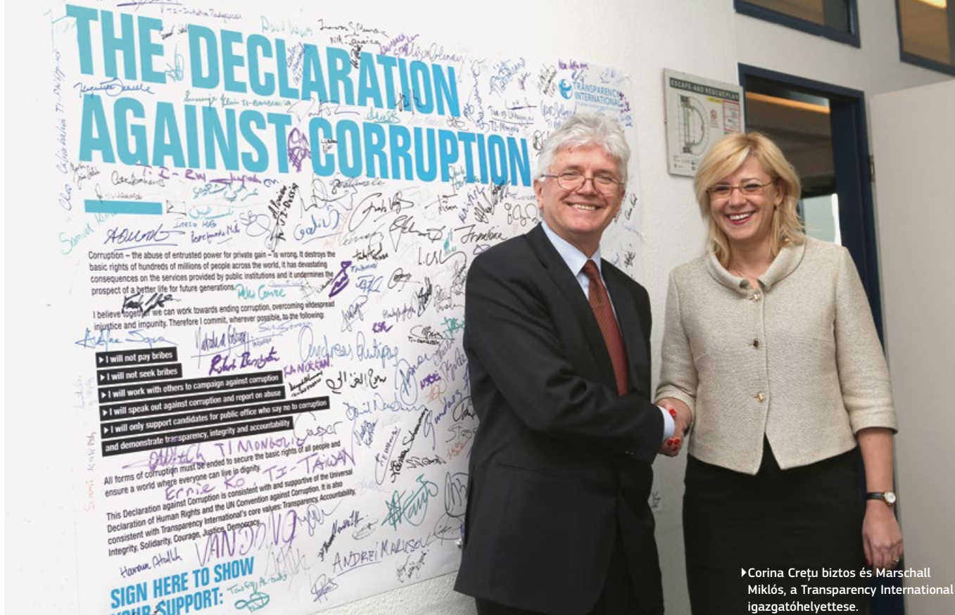
► Corina Crețu biztos és Marshall Miklós, a Transparency International igazgatóhelyettese.

A Bizottság a Transparency International szervezettel szorosan együttműködve úgy döntött, hogy kísérleti jelleggel több uniós társfinanszírozású projekt esetében alkalmazni fogja az eszközt. 2015 májusában felhívást tettek közzé a kezdeményezésben való részvételre, ami mind a közigazgatás (az uniós alapokat irányító hatóságok vagy az uniós támogatás kedvezményezettjei), mind a civil társadalom szereplőit megszólította. A felhívás fogadtatása minden várakozást felülmúlt. A Bizottsághoz összesen 13 tagállamból 56 pályázat érkezett, közülük 25-öt a civil társadalom, 31-et a hatóságok nyújtottak be. Jelenleg is zajlik a kiválasztott projektek előkészítése a végrehajtási szakaszra.