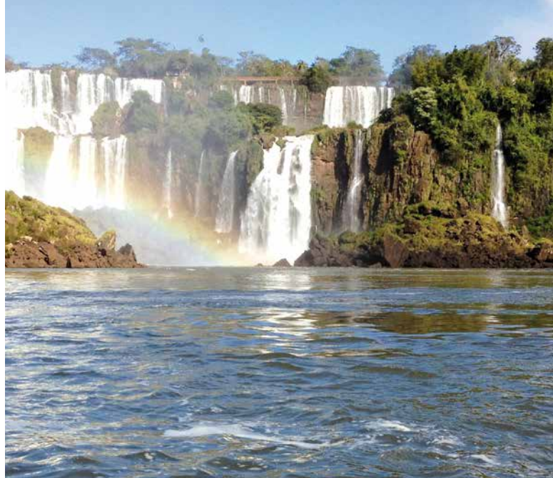
▶ Az Iguazú-vízesés az argentin–brazil határon.

A határokon átnyúló együttműködéssel összefüggésben a regionális innovációs stratégiák terén Peruvál nem is olyan régóta (2013 óta) folyó együttműködés máris figyelemre méltó eredményeket hozott. A Cusco és Tacna régiókban európai módszertannal megvalósuló, kísérleti regionális innovációs tanulmánynak köszönhetően új partnerségek jöttek létre vállalkozások (kkv-k), egyetemek, kutatóközpontok és helyi hatóságok között annak érdekében, hogy a regionális fejlődés fellendítése érdekében azonosítsák és fejlesszék a hozzáadott értékkel rendelkező tevékenységeket.