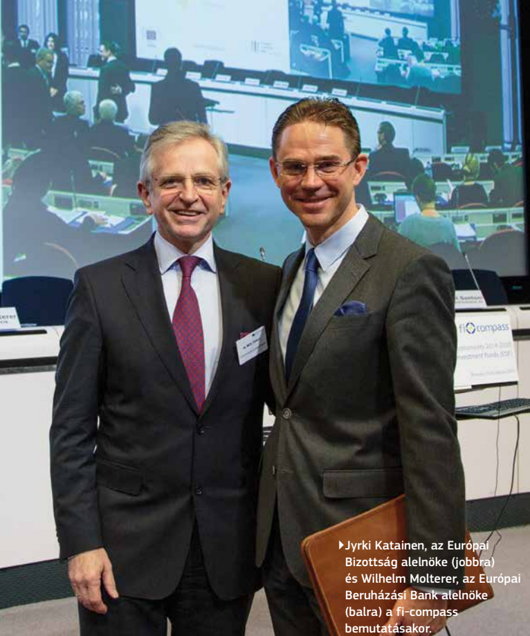
▶ Jyrki Katainen, az Európai Bizottság alelnöke (jobbra) és Wilhelm Motlterer, az Európai Beruházási Bank alelnöke (balra) a fi-compass bemutatásakor.