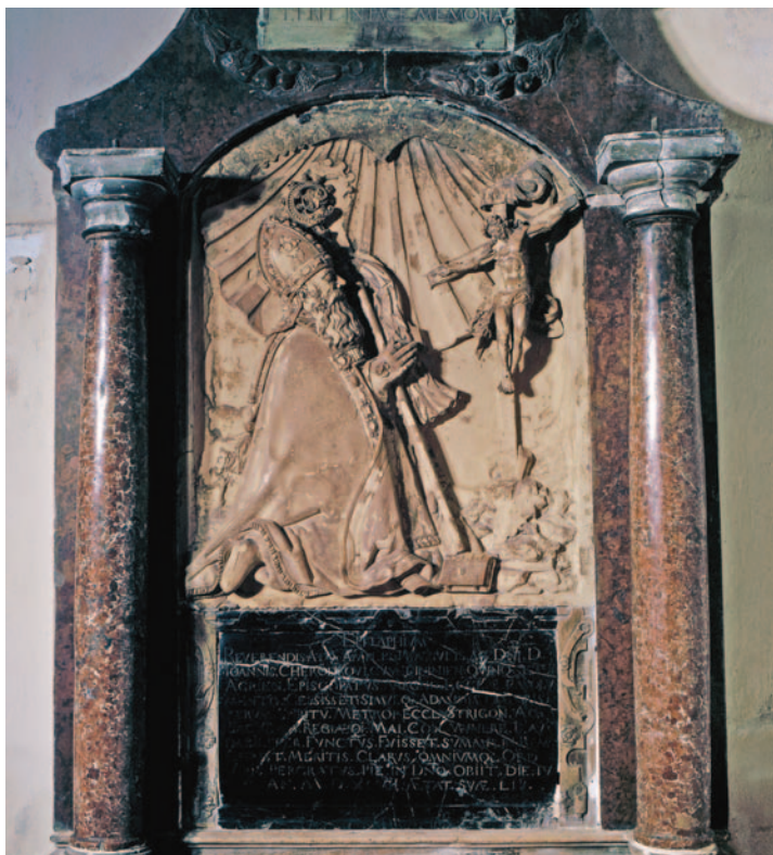
CHEREÓDI SÍREMLÉKE A NAGYSZOMBATI SZÉKESEGYHÁZBAN.

a S/ANCTA/ MARIA PATRONA REGNI HUNGARIE felirat is alátámaszt. A patróna fontosságát hangsúlyozta a metszetkészítő, amikor a Szűz jobbára Szent Istvánt állította uralkodói joggal. Köpenyének felirata: S/ANCTUS/ STEPHANUS R/EX/ HUNGARIE/! 58 István baloldalán Szent Imrét liliummal ábrázolták. Kardjának felirata: S/ANCTUS/ EMERICUS DUX SCLAVONIE/! 59 Szűz Mária balján áll Szent László kezében bárdal. Köpenyének felirata: S/ANCTUS/ IADISLAUS R/EX/ HUNGARIE/! 60 A Magyarok Nagyasszonya ölében a kis Jézussal szép faragott trónon ül, feje