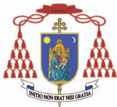
ERDŐ PÉTER BÍBOROS CÍMERE.