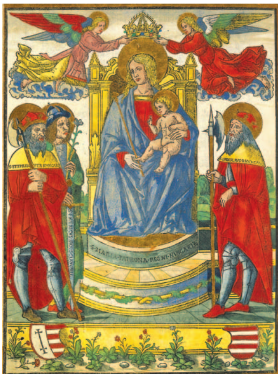
A CHEREÖDI-MISSALE SZÍNEZETT FAMETSZETE. Főszékesegyházi Könyvtár, Esztergom. Missale Zagrabienne.

Az Esztergomi Főszékesegyházi Könyvtárban őrzik a Chereödi-misekönyvet, amelyet Missale Zagrabienne sének is nevez az irodalom. 56 A papír- és hártyafóliókból álló kötetet két hasábban készítették 1511-ben a velencei Petrus Liechtenstein nyomdájában. Magyar mester díszítette 1592-ben. Két festett lapkeret díszíti, és két címert ábrázol Szent István és Szent Adalbert képével. A kötése XVI. századi vörös bársony, fatáblákon, aranyozott ezüstveretekkel, az evangélisták alakjaival díszített 8 sarokkerettel és 2 köldökkerettel. A felső köldökkereten