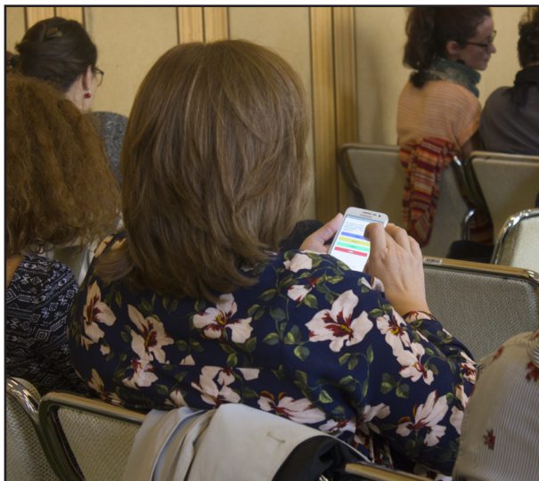
Mentimeter használat közben

A négy alkalomból egyszer próbálkoztunk online közvetítéssel. A megnyitónak és az első előadás közvetítésének 342 megtekintése volt, a második előadásnak 138, a harmadiknak 131, a negyediknek 139. A technikai megvalósítás nem működött zavartalanul, ezért nem folytattuk a közvetítést, de dolgozunk egy jobb megoldáson, hogy azok is élőben követhessék a K2 előadásait, akik személyesen nem tudnak megjelenni.