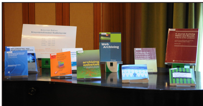
A KSZK könymválogatása

A továbbképzési sorozat egy folyamatosan megújuló szolgáltatása a Könyvtári Intézetnek. Az előadásokról videófelvételt készítettünk 4 , a szakmai napokról pedig beszámolókat tettünk közzé, amelyek a prezentációkkal együtt elérhetők a Könyvtári Intézet oldalán 5 . A rendezvények alatt az érdeklődők válogathattak a Könyvtártudományi Szakkönyvtár (KSZK) friss, az aktuális témához kapcsolódó beszerzéseiből, amelyeket minden alkalommal a pódium mellett álló, kultikussá vált zongorán helyeztünk el. Az érdeklődők ezeket a dokumentumokat ki is kölcsönözhatték, továbbá az ODR-ben is megkérhetőek voltak.