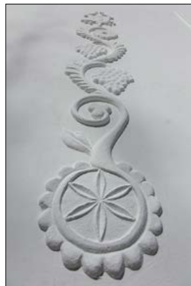
Közele felvétel az épület egyik visszatérő motívumáról

G. A.: A vakolathímzés népi építészetünknek hasonló műfaja, mint az asszonyok hímzése, varrottása. Eredetében mindegyik magas szintű képírás. Pap Gábor művészettörténész már régen megfogalmazta a következőket: a magyar irodalmat, illetve a magyar zenét népdalaink nyelvezetén, illetve zenéjén keresztül Petőfi, illetve Bartók és Kodály emelték be a világirodalomba, illetve a világszínvonalú zenei életbe. De a képzőművészetünk felől a vizuális népművészetünkhöz vezető utakat az elmúlt rendszerben gondos kezek beszántották, vagy elfalazták, s emiatt a világszínvonalú és egyetemes szintű magyar képzőművé-