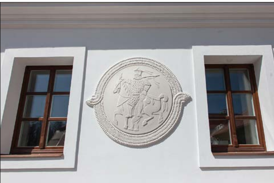
Vakolathím a nagyszentmiklósi kincs 2. kancsójának részletéről

is, helyesebben, ahogy Mátyás király mondotta, az üdvtörténelmünk. Mi ezt a külső-belső üdvtörténelmet igyekeztünk megjeleníteni a Nemzeti Művelődési Intézet új székházának homlokzatán.