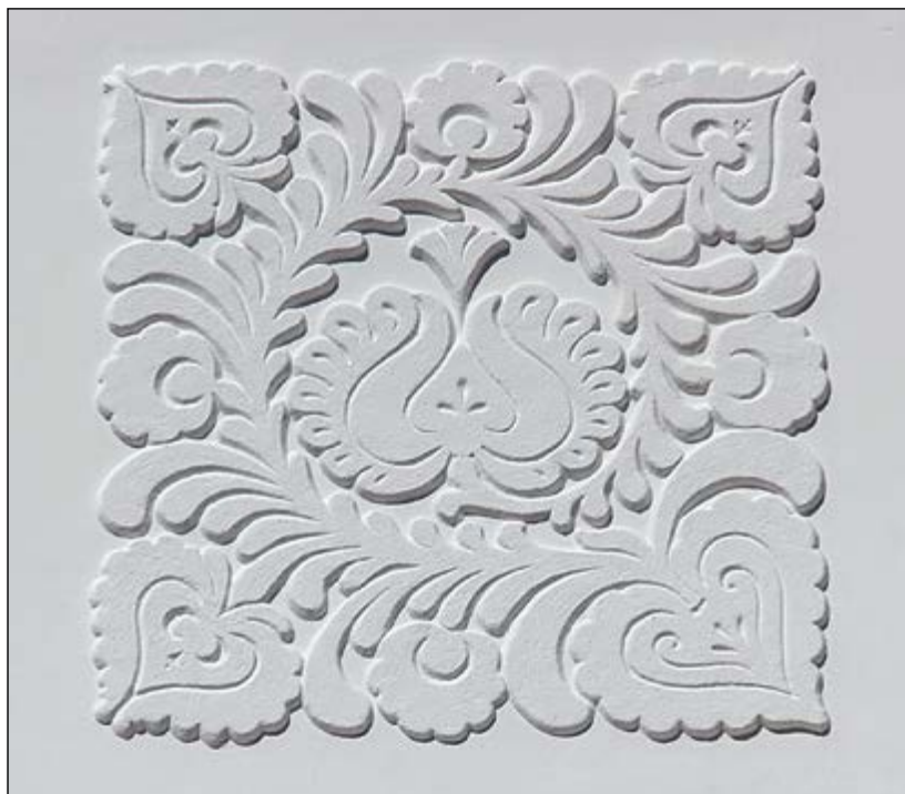
„Lelkemből lelkezett gyönyörű magzatom” – Arany János