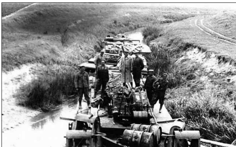
A Báger partján

után, Mária Terézia telepítésrendelete nyomán indult el ez a folyamat. Német parasztokat és iparosokat hívtak hazánk területére. II. József folytatta édesanyja munkáját és ezáltal közel félmillió telepes érkezett a gyéren lakott területekre. Az ide érkező parasztok házhelyet, szántóföldet és kaszálót kaptak. Egészen az 1820-as évekig húzódott ez az időszak. Császártöltés hivatalos megalapításának dátumát 1744-re teszik a kutatók és Patachich Gábor kalocsai érsek nevéhez kapcsolják. Valószínűsíthető, hogy a Csákányfő pusztanévől keletkezett a falu neve. Nevének írásos nyomát 1734-ig nem sikerült felfedezni semmilyen okiratban, ekkor is csak „Csakanyfeo” pusztaként említik. A néphagyomány többféleképpen is magyarázza a nevét, ezekre azonban nincs írásos bizonyíték. Az egyik változat szerint a Bécsből hazafelé tartó Szulejmán török szultán számára kellett utat és töltest készíteni. A másik