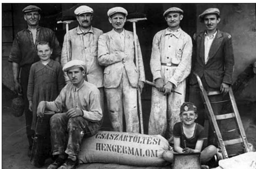
A császártöltési hengermalom

Herrschaftsweingarten: Az uradalmi szőlők 25-30 kat. hold nagyságú területét hívták így, ahol a falu népe a kötelező robotot teljesítette. 1769-ben