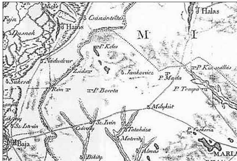
1. számú ábra

A terület vízrajzi képe a XIX. század elején 10