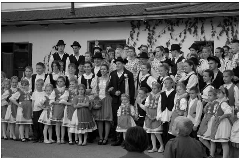
Csúzai szüreti fesztivál táncosai

Találtunk az egyik meglátogatott családnál egy képet, melyről elmondható, hogy a Drávaszög-Szlavónia Kollégium esszenciáját adja. Egy megsárgult fotóról egy díszes uniformisba öltözött férfi néz ránk – a XIX. sz. végéről vagy a XX. sz. legelejéről. Tisztes helytállása, történetei már csak legendák. Egy-egy szolgálati élménye, nevezetes csatához vagy éppen egy jeles társasági eseményhez fűződő története generációkon keresztül hagyományozódott át. Ma már hiába keresnénk a férfit, a világot, amelyben hitt, élt és tette a dolgát, a letűnt idők a múltba veszttek, az e vidéknek adatott nem éppen eseménytelen történelem tengerén. De a kard, amelyet az oldalán oly büszkén visel a képen, az megvan. Kézbe lehet fogni, meg