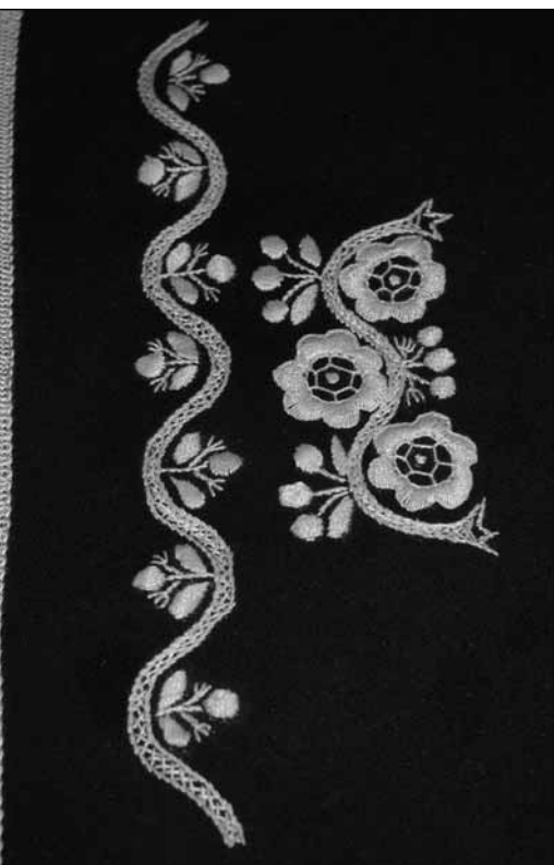
Baranyai tradicionális hímzés

részt a térség több településével való összefogásban kijánlott turisztikai – nem utolsó sorban öko-turisztikai –, kulturális, természetvédelmi és gasztronómiai programlehetőségek együttesen jelenthetnek kitörési pontot. Vörösmarton pl. egy régi kádár (hordókészítő) műhely minden eszköze megmaradt, amelyből múzeumot szeretnének létrehozni. Két szépen rendbe tartott pincsort találtunk, ígéretes az idegenforgalom terén. Van egy múzeumuk, amelyet a dél-szláv háború elpusztított, és most szeretnék feltámasztani. Van egy „Dália” klub, ahol pár asszony horgol, hímez, fest (tányérra, üvegre, tökre) és csodákat csinálnak. Rengeteg „szín”, rengeteg „érték” van, találtunk hagyományos recepteket, akadt olyan ember, akinek hatalmas fotógyűjteménye van helybeli eseményekről, emberekről, lakik a településen olyan ember, aki különböző technikákkal rajzol és fest. Aktív egy kulturális egyesületük (József Attila Kultur Egyesület), amely tánc csoportot, énekkart működtet, jeles ünnepeik alkalmával méltó módon emlékeznek. De hasonló elmondható szinte mindegyik drávaszögi és szlavóniai település esetében.