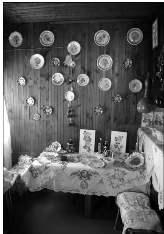
A Vörösmarti „Dália” klub alkotásai