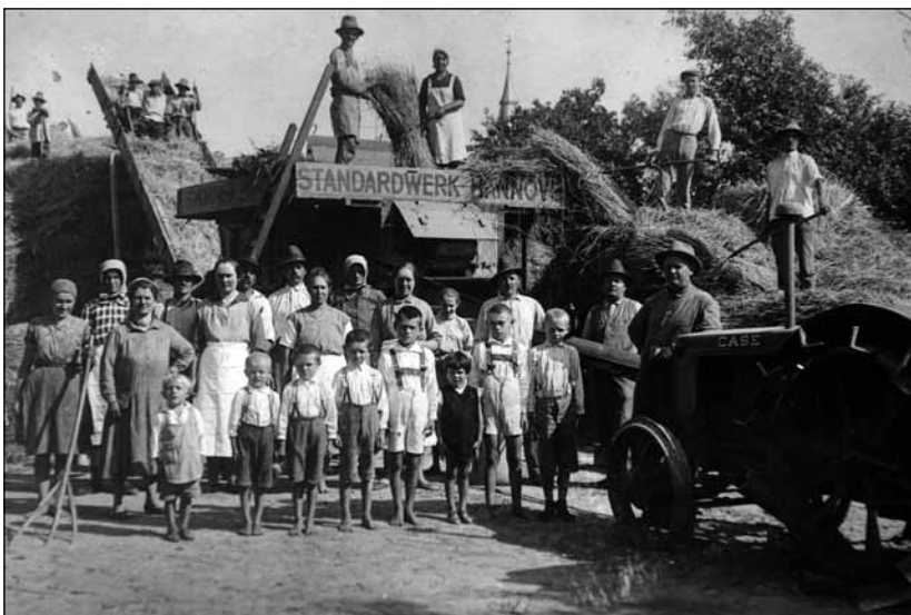
Egy régi kép a XX. sz. elejéről