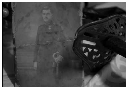
Régi fotó és a kard

A terepmunka két következményre feltétlenül járt. Az egyik az, hogy a meglátogatottakban megmozdí-