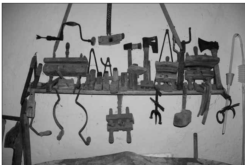
Pintér eszközök Vörösmarról

foglalkoztak. A vázolt tevékenységi körök határozták meg az iparosok, kézművesek sorát, kádárok, pintérek, halászok lakták a települést. Több dunai kikötő is működött, ahonnan a környékben megtermelteteket szállították el. A környék meghatározó kisvárosa volt pl. Vörösmart, mintegy 2000 fő lakta és magyar anyanyelvű gimnáziuma is volt. A II. világháború után a svábok elmentek, illetőleg elűzték őket, a zsidóságot pedig még