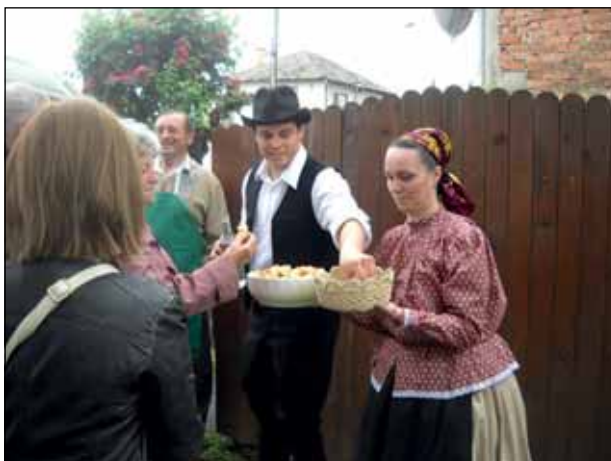
Érkezés és fogadás