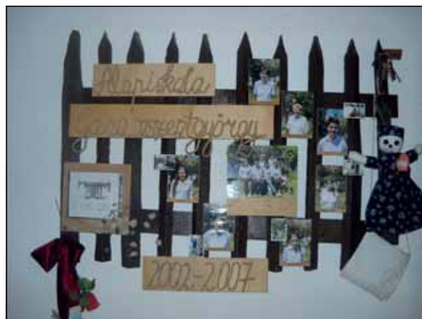
Iskolamúzeum az épületben, ahol a hagyományörző osztály tanul.