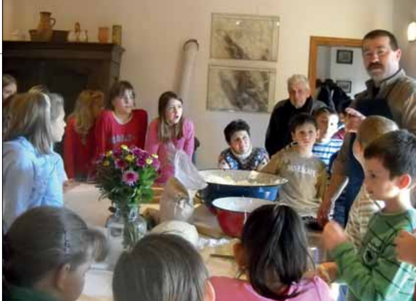
Káposztasavanyítás Felpécen – Géber József néprajzossal