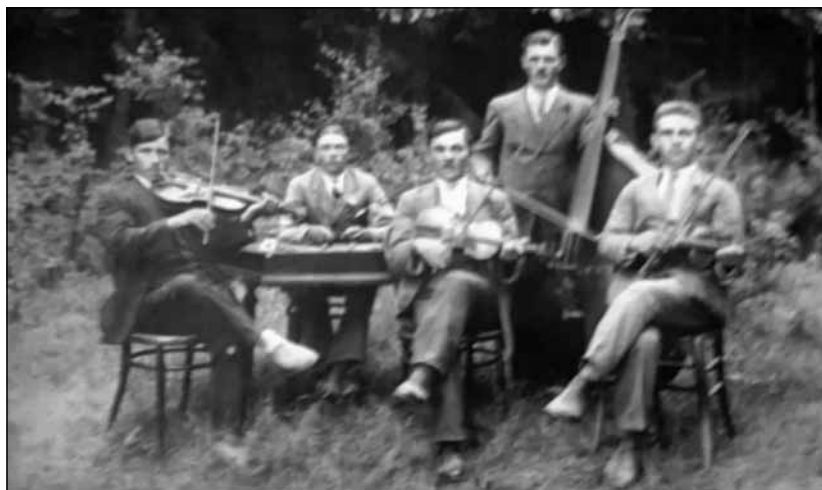
Nemeshanyi zenészek – múlt század. A cimbalmos a falu polgármestere nagypapjának testvére. A képen látható nagybőgő a Tájházban látható, kiállítva.