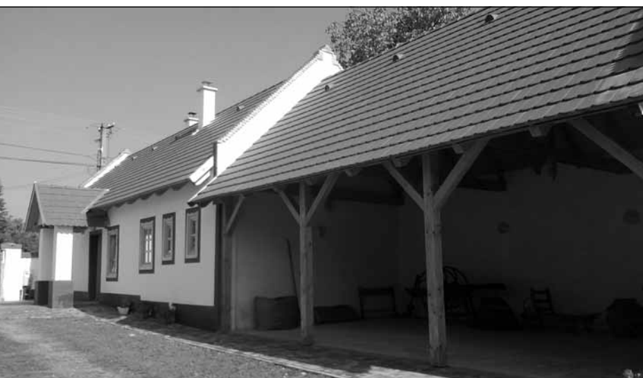
Az újonnan átadott tájház

K. A.: Volt nekünk egy zenekarunk..., illetve van. A zenekari egyesülettel pályáztunk a Pajtaszínházra.