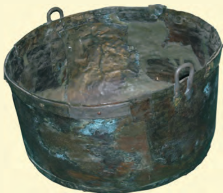
A várban talált középkori rézüst (1974)

A vár építésének, keltezésének szempontjából az északi fal belső oldalán az egyik korábbi ásatási felület mellett nyitott szelvény (1.) bizonyult a legjelentősebbnek. Megfigyeléseink szerint a falat az andezit-málladékos altalajra lépcsősen bevágott padkára emelték, az alapfalat egyazon szélességben a felmenő fallal, átmettszve egy barna, tömött kultúrreteget,