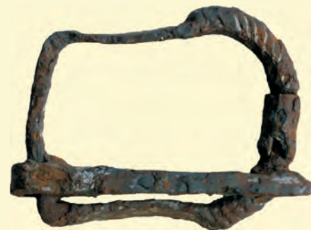
Vasból készített, ezüsttel tausírozott, ún. líra alakú csat (2009)