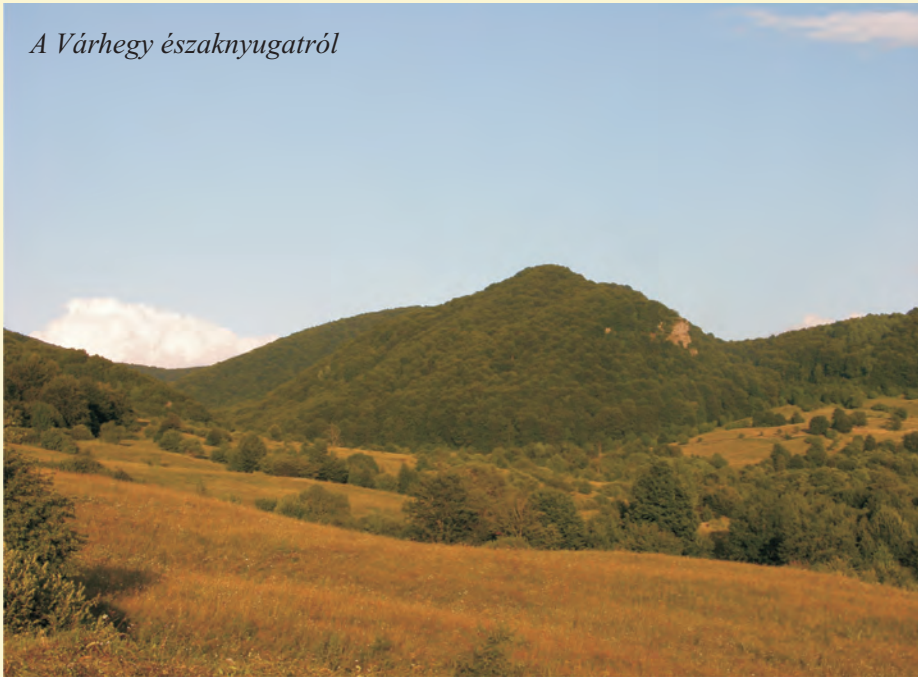
A Várhegy északnyugatról