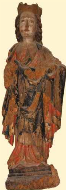
A középkori Mária szobor