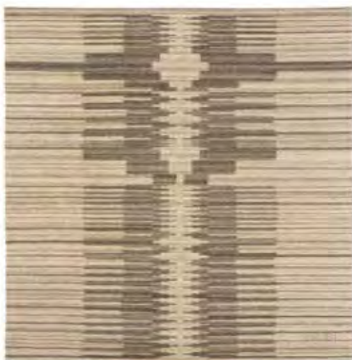
ARDAI Ildikó: Jelfa I. | Ildikó ARDAI: Sign-tree I 2008, festetlen rackagyapjú, kilimszövés, 200x200 cm