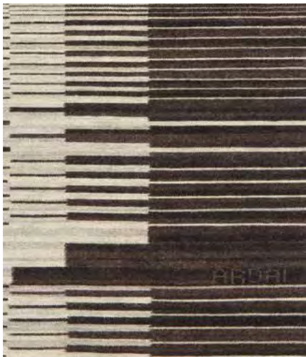
ARDAI Ildikó: Jelfa II. (részlet) | Ildikó ARDAI: Sign-tree II (detail)