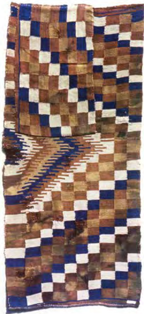
Sakktáblás-csillagos szőnyegtöredék Carpet fragment with chessboard and stars pattern 19. század (Csíki Székely Múzeum, Csíkszereda)