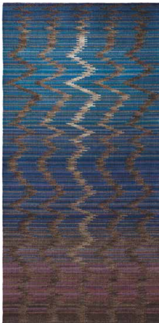
ARDAI Ildikó: Égszakadás | Ildikó ARDAI: Cloudburst 2016, festett és festetlen rackagyapjú, négynyüstös kilimszövés, 350x150 cm