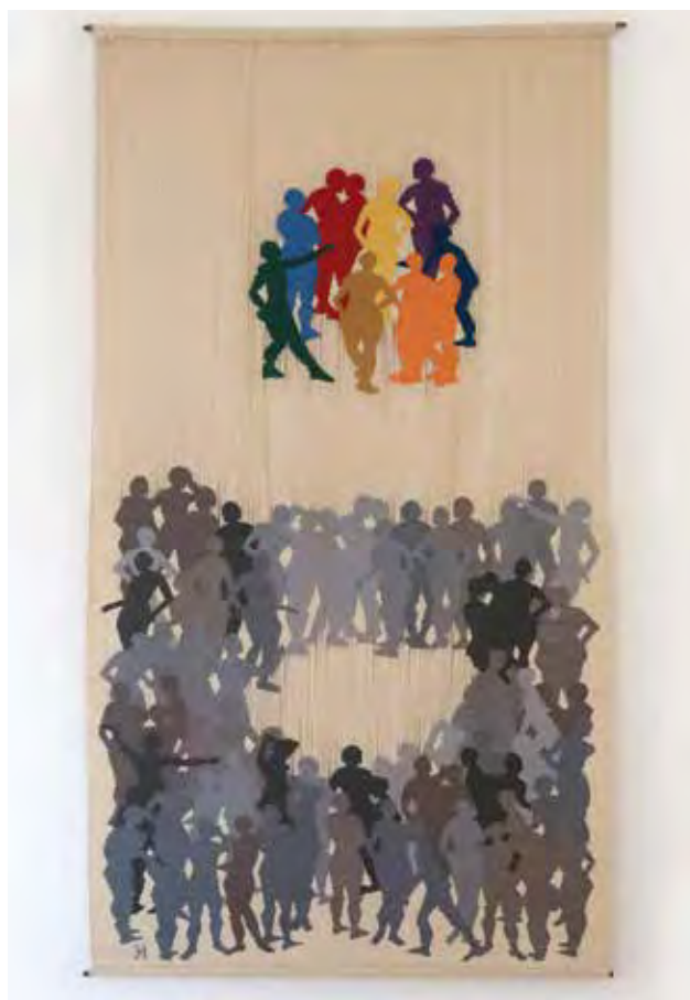
KNEISZ Eszter: Kint és bent | Eszter KNEISZ: Outside and inside 2008, gyapjú, pamut, szövés, 197x105 cm

címmel rendezett nemzetközi kortárs kiállításra, vagy a Rómában, Bukarestben, Bakuban megrendezett, s az ősszel remélhetően Helsinkiben is megvalósuló csoportos tárlatokra utalni.