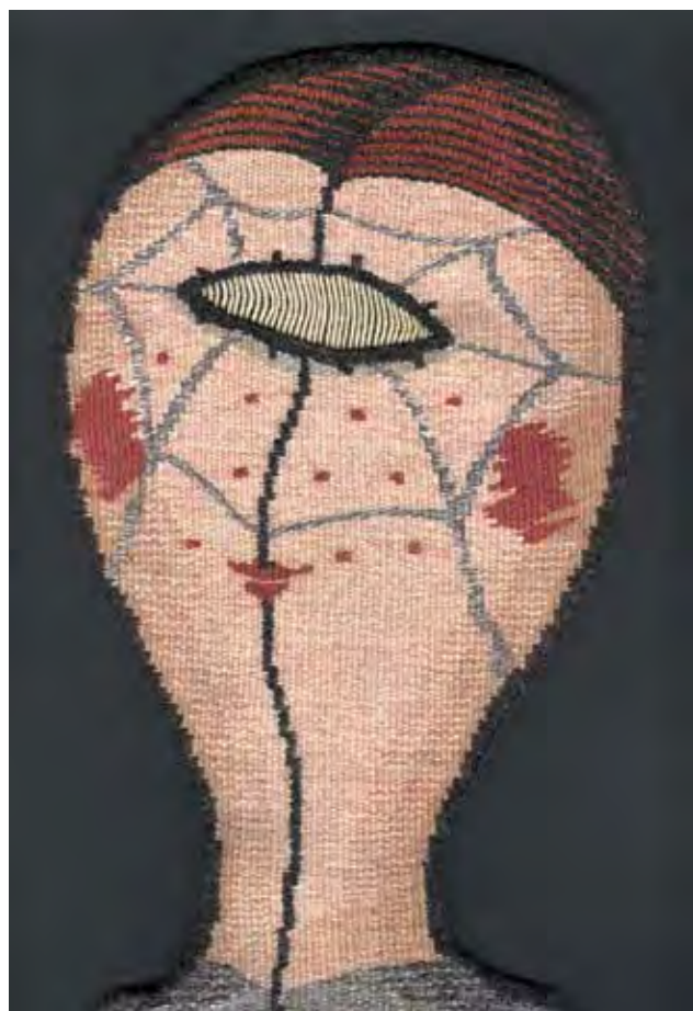
KISS Katalin: Maszk III. | Katalin KISS: Mask III 1991, gyapjú, francia kárpit, formára szőtt minitextil, 28x17 cm