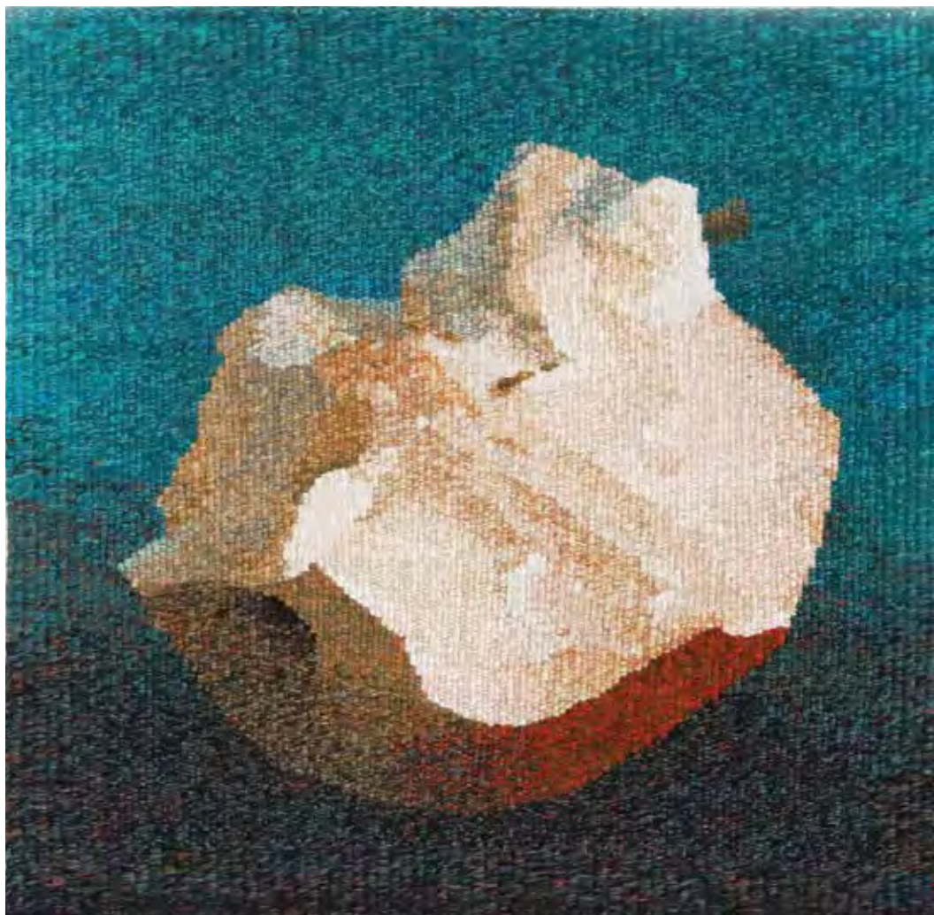
MÁLIK Irén: Így kezdődött... | Irén MÁLIK: That's how it began... | 2010, gyapjú, francia kárpit, 70x70 cm