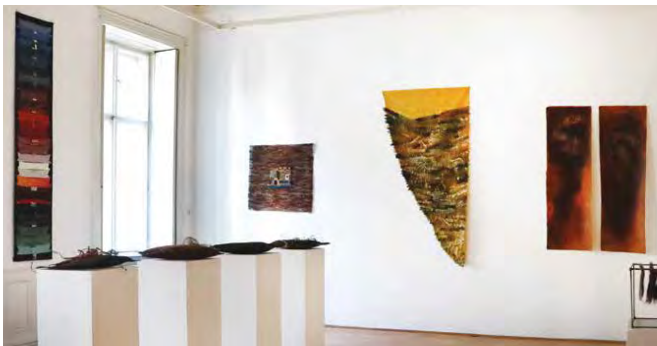
Összefonódó szálak című kiállítás (részlet) | Interlacing threads (exhibition photo) | MKISZ Andrassy úti kiállítótere, Budapest, 2020

BOLGÁR–MAGYAR TEXTILKIÁLLÍTÁS HÁROM BUDAPESTI KIÁLLÍTÓTÉR BEN