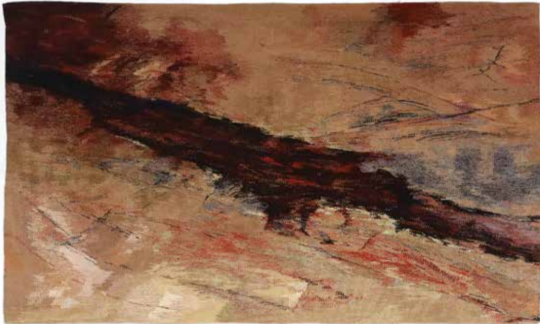
SIPOS Éva: A folyó sötét lemez | Éva SIPOS: The river is a dark sheet | 2012, francia kárpit, 90x140 cm