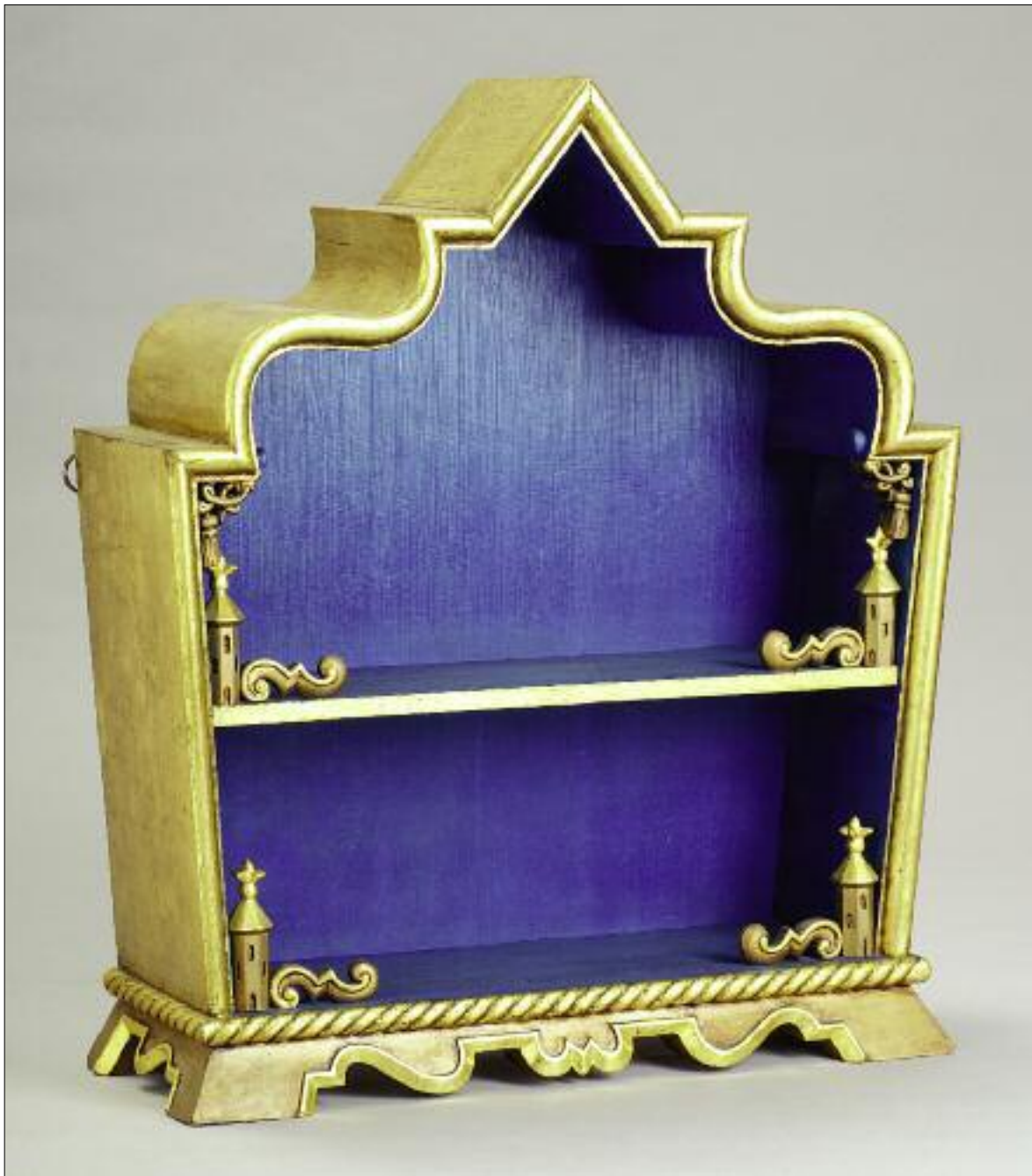
Kozma Lajos: Szekrényke. Kivitelezés: Budapesti Műhely / Lajos Kozma: Cabinet. Manufacturer: Budapest Workshop Budapest, 1918/1920 körül, belül festett fenyő, kívül arany metállal borított, faragott tagozatokkal, jelzetlen, 65,5x57x20 cm (Grosz Judit gyűjteménye)