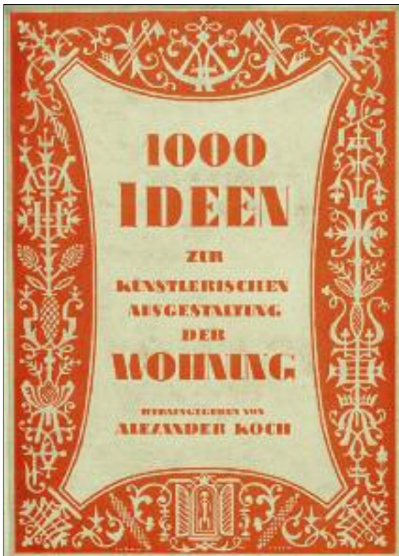
Kozma Lajos: Könyvborító (1000 Ideen zur Künstlerischen Ausgestaltung der Wohnung. Hrsg. Alexander Koch. Darmstadt, 1926) / Lajos Kozma: Book cover (1000 Ideen zur Künstlerischen Ausgestaltung der Wohnung. Hrsg. Alexander Koch. Darmstadt, 1926)

Iparművészeti Múzeum, Könyvtár, Budapest