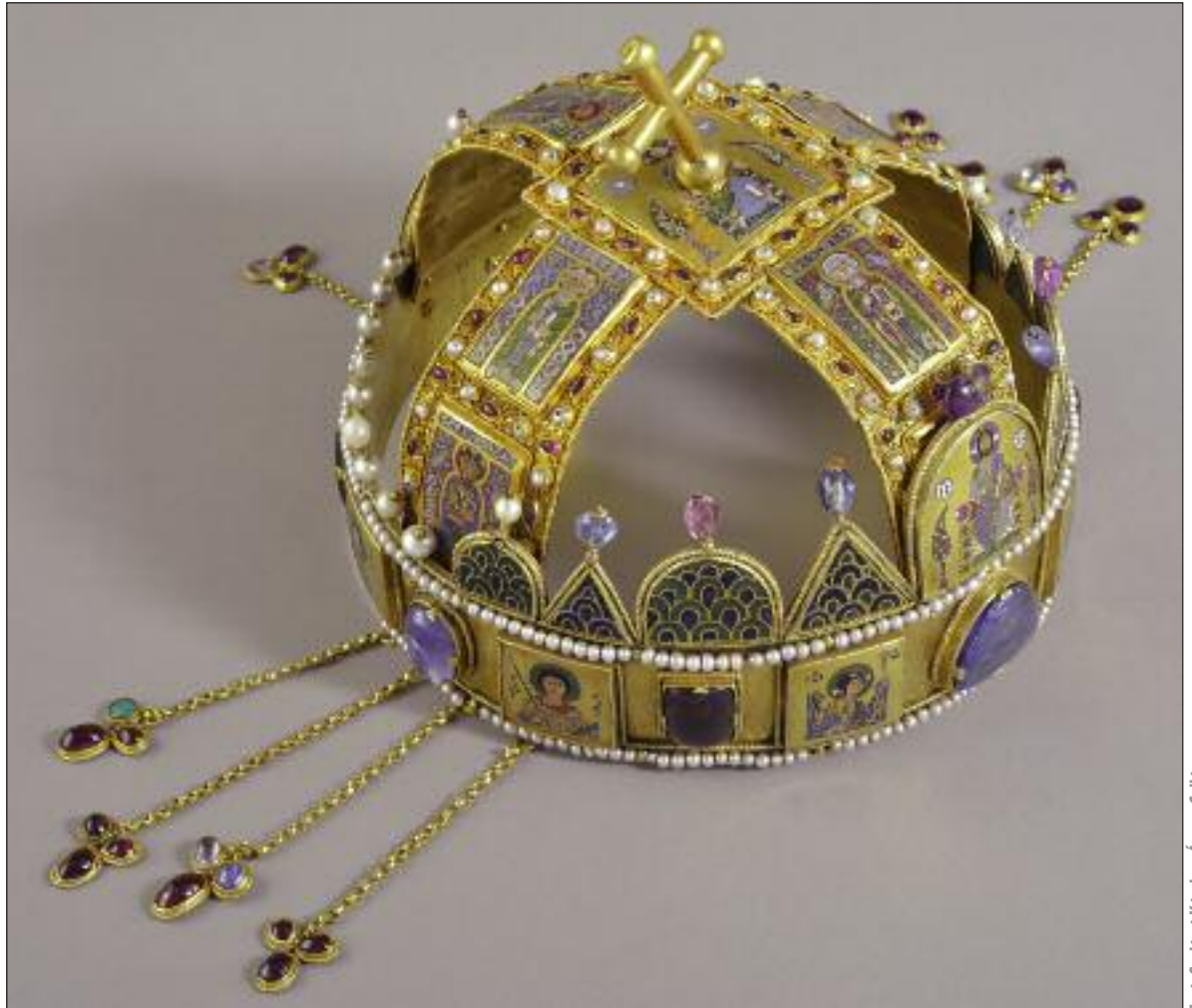
A Szent Korona a béléssapka nélkül / The Holy Crown of Hungary without the lining cap

A koronaékszerek mindegyike külön fejezetet kapott, hiszen valamennyi műtárgy jellegzetesen egyéni kialakítású, különböző korú technikai hátteret hordoz. Erre a tényre leginkább példa maga a Korona, amely – véleményem szerint – elsőrendű műtárgytörődékeknek minden szakmai kíváncsát, vagy ikonográfiai következetességet figyelmen kívül hagyó