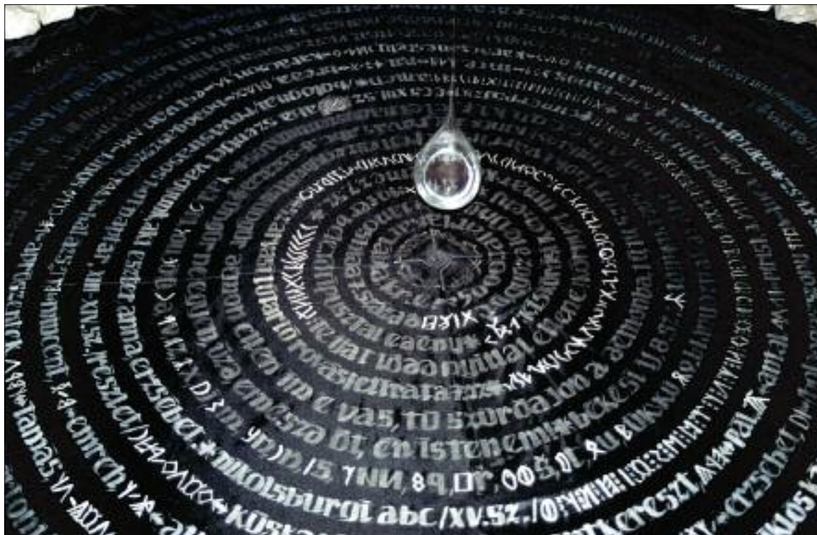
Csete Ildikó: Pannon-tengeri töredékek (részlet) / Ildikó Csete: Fragments from the Pannonian Sea (detail)

A fotókat a művész örököse bocsátotta rendelkezésünkre Csete Ildikó albumának (Püski Kiadó, 2015) képanyagából.