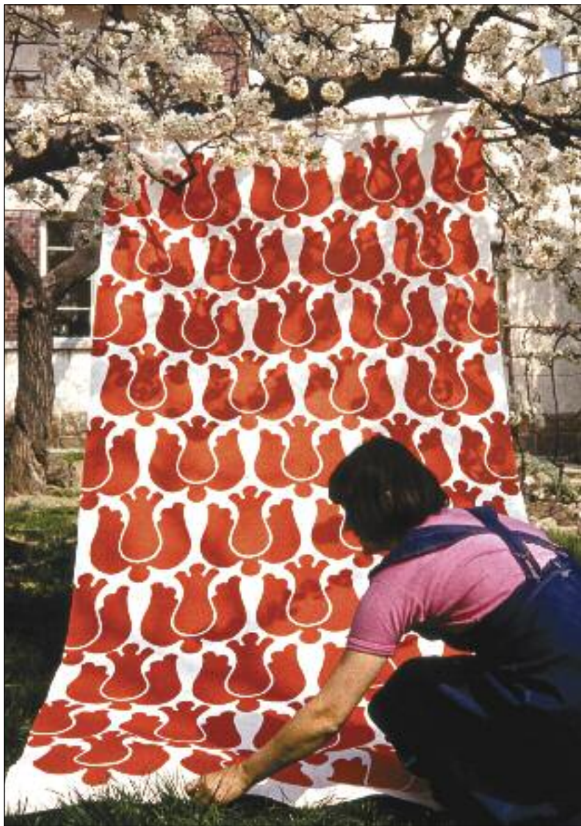
Fotó: Csete Őrs

Csete Ildikó a piros tulipános drapériával, 1984 körül / Ildikó Csete with a fabric with red tulip patterns, c. 1984