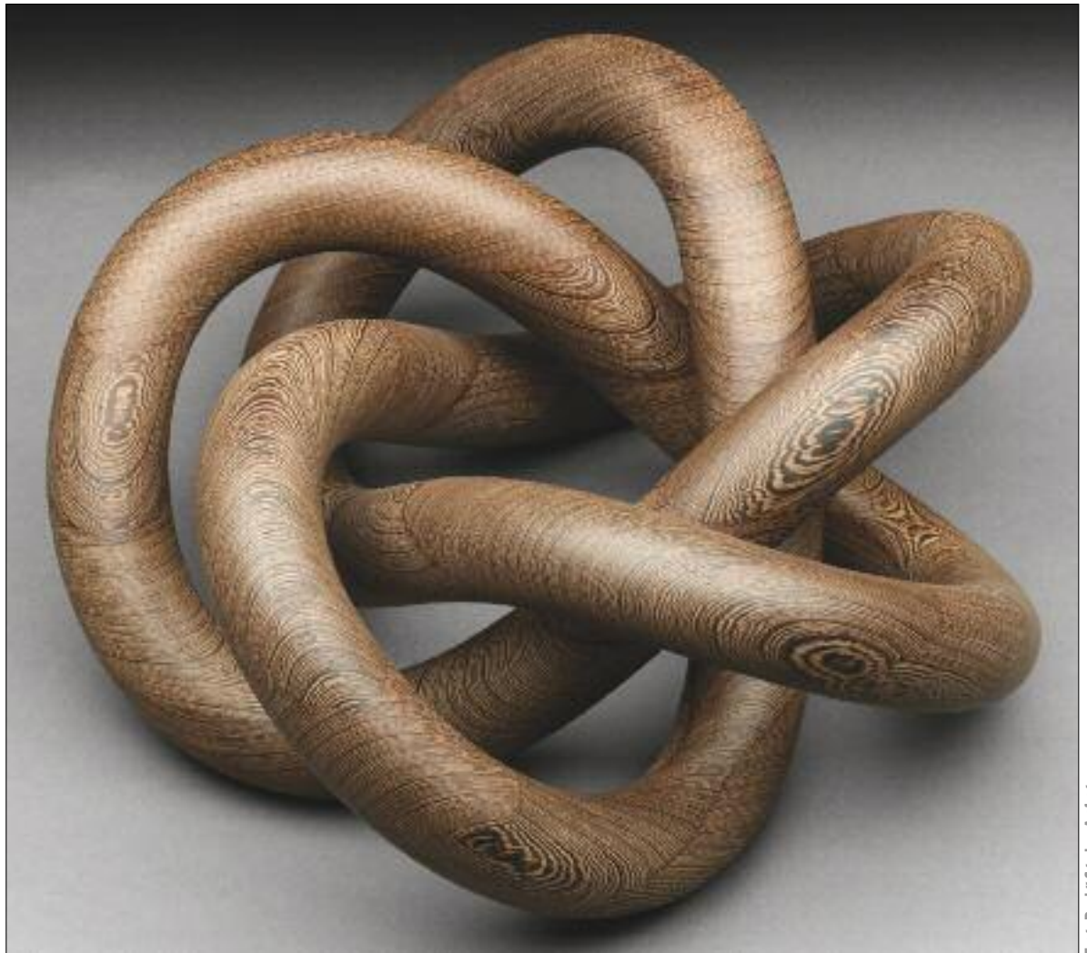
Szőcs Miklós TUI: Tendenciák V. / Miklós Szőcs TUI: Tendencies, V 2000, wengefa, 20x45x45 cm

A rendezők láthatóan törekedtek arra, hogy a meghívott művekkel bemutassák a művésztelep és a GIM szellemi és filozófiai rokonságát. A művésztelep életéről fellelhető dokumentumok közül Körösfői-Kriesch Aladár leszármazottai hozzájárultak néhány, az 1930-as években készült fotó reprodukálásához, amelyek megőrizték a régi időknek azokban az években még meglévő nyomát. Buja nőszirmocsoportok, dús lombú fák között játszó gyerekek tűnnek fel e képeken, s a