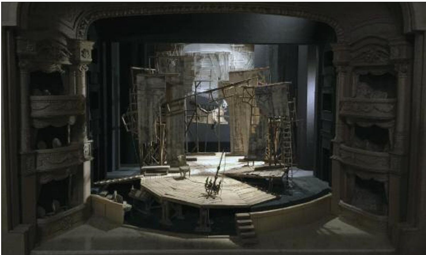
Fotó: Bagossy Levente

Bagossy Levente: Színházi makett az Úrhatnám polgár című előadáshoz (Vígyszínház, Budapest, 2007) / Levente Bagossy: Stage maquette for the performance The Bourgeois Gentleman (Comedy Theatre of Budapest, 2007) papír, ragasztott, applikált, 60x73x54 cm