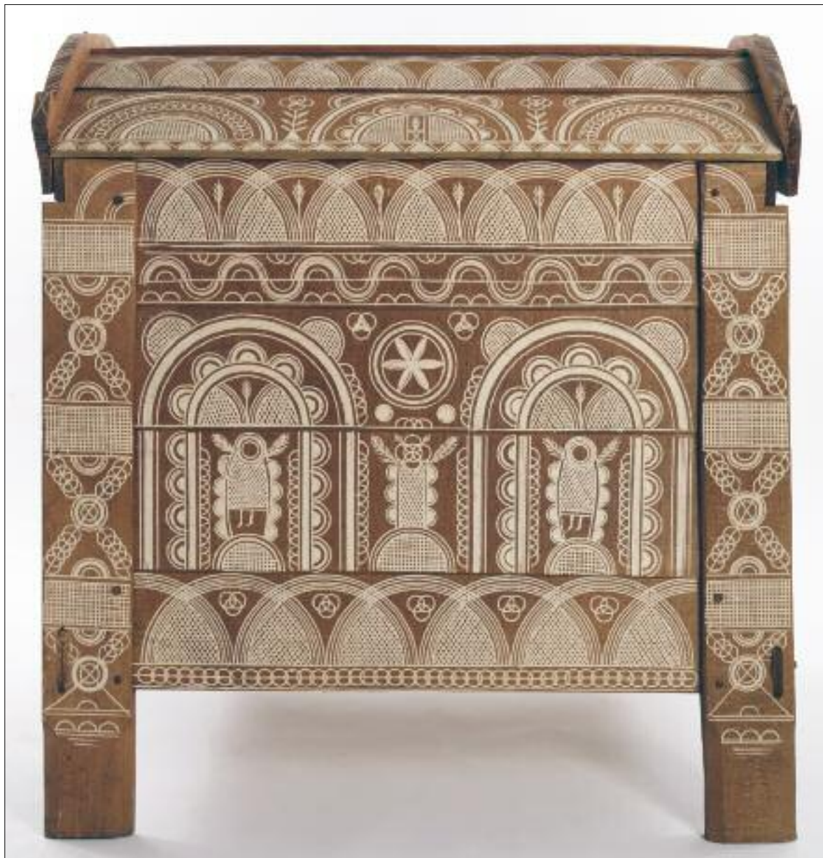
Gyenes Tamás: Ácsolt láda / Tamás Gyenes: Chest