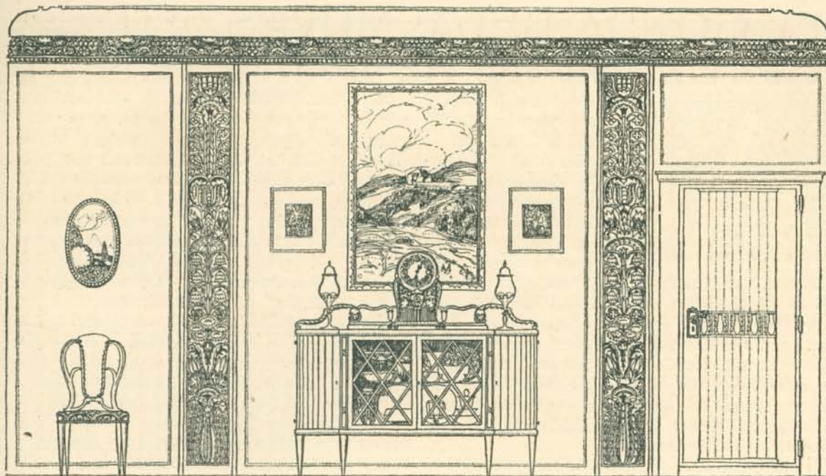
A Gellértfürdő és szálló berendezésére hirdetett pályázat. Bodon Károlynak 600 korona díjat nyert pályaműve. 5000 koronás szalon egyik fala.