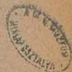
ORMÁNSÁGI „SZÖKRÉNY” ÉS KÖDMÖN.