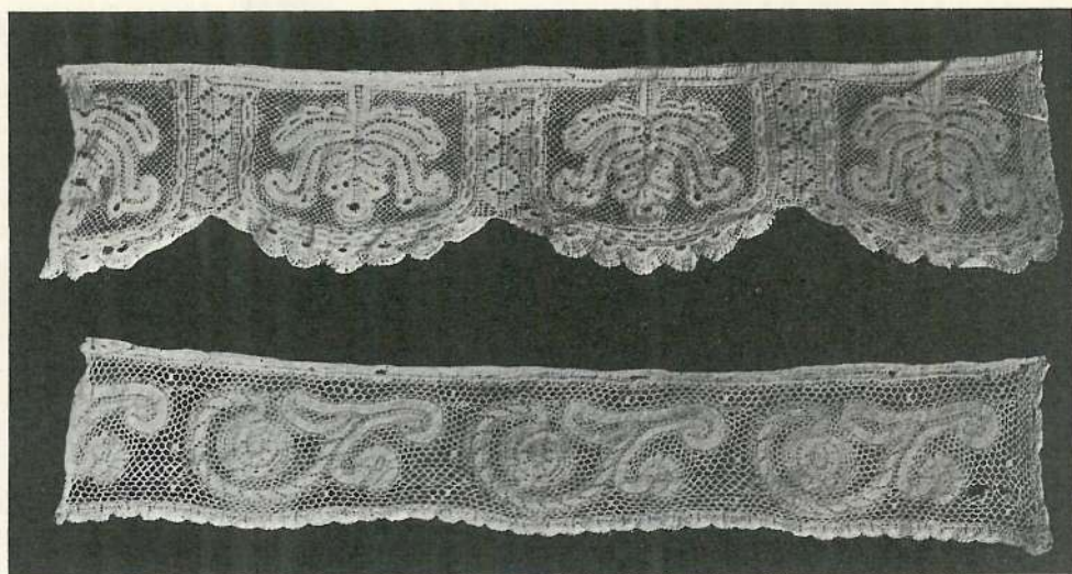
RÉGI GÖMÖRMEGYEI CSIPKÉK. (5. ÉS 6. SZ.)

a technika megkövetel, mennyire törekedtek mégis az ornamentnek ideális organizmust adni és pedig nem sikertelenül.