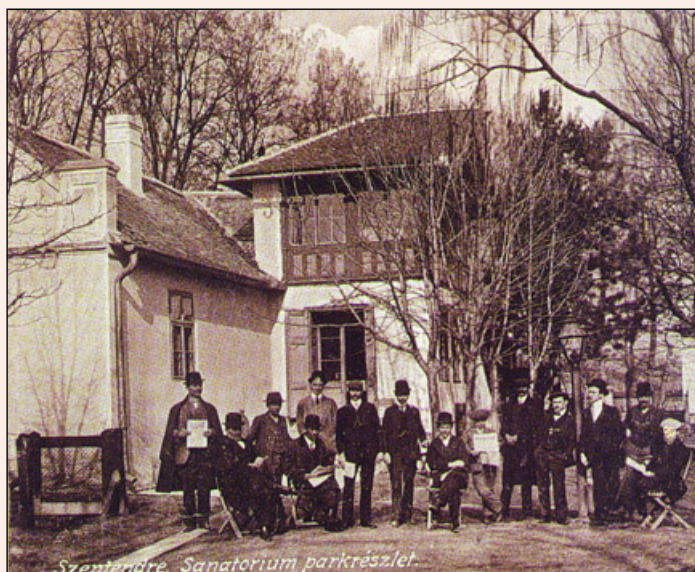
„A régi Régi Művésztelep“

2005. november 22. és november 27. között rendezett kiállítást a Szentendrei Műhely Galériában a Magyar Alkotóművészeti Közalapítvány a Szentendre Régi Művésztelep felújítására és bővítésére kiírt tervpályázat pályamunkáiból. A kiállításon a díjazottak és megvásárolt pályaművek mellett valamennyi pályázati munka megtekinthető volt. A zsűfólaság megtelt galériában a megnyitő ünnepségen részt vettek lapunk munkatársai.