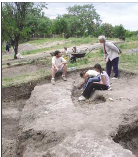
Sok vidéki helyszínen, köztük az Ulcisia castra római katonai tábor feltárásnál, Szentendrén is várják az érdeklődőket

megőrzésére, védelmére (különös tekintettel a veszélyeztetett emlékekre),