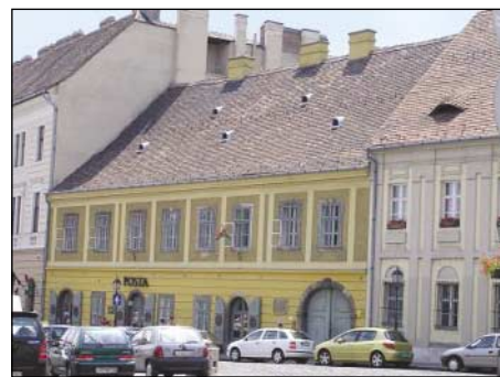
A budapesti De la Motta palota is látogatható lesz az idén

Jóllehet az alapelvek között csupán ajánlásként