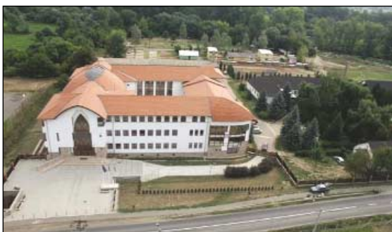
A kurzusok helyszíne a Kereskedelmi és Idegenforgalmi Középiskola

A 9 napos kurzus célja, hogy a komolyzene művelői elmélyülhessenek a barokk és a reneszánsz muzsika világában. A kurzus szervezőinek sikerült olyan fiatal, magyar régizene-specialistákat meghívni, akik külföldön tanulnak, külföldön szereztek elismerést és több nemzetközi versenyt is megnyertek. A művésztanárok és a „növédek” látogatható kon-