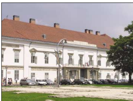
Kinyitja kapuit a Köztársasági Elnöki Hivatalnak otthont adó Sándor-palota

1984-ben Franciaországban Történelmi Műemlékek Nyílt Napja (Historic Monuments Open Day) címmel egyedülálló kezdeményezés indult útjára, azzal a céllal, hogy azok a kiemelkedő, várhatóan széles érdeklődésre számot tartó műemléképületek, amelyek általában zárva vannak a nagyközönség előtt, egy hétfvégén nyissák meg kapuikat, és ingyen, lehetőleg szakszerű vezetéssel fogadják a kíváncsi látogatókat.