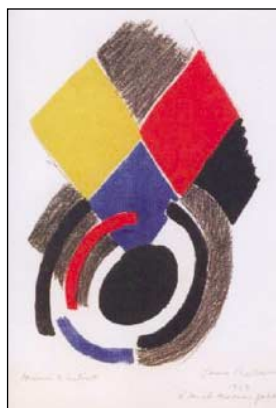
Sonia Delaunay: Kompozíció, 1963. (Mezei Gábor gyűjteményéből)

Tóth Menyébert, Vajda Júlia, Victor Vasarely, Vaszary János és mások számukra valamely oknál fogva oly kedves alkotását közgyűjteménynek kölcsön adják, megosztva másokkal azt az örömet, amit egy szerencsés pillanatban született olajfestmény, grafika vagy szobor az őt szemlélőnek szerez.