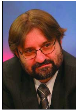
Bozóki András virtuális fogadóórán várta a kérdéseket, ötleteket

Kulturális portálunk, a www.kultura.hu nemrégiben elindult „fórum” rovatában havi rendszerességgel lehet művészeket, szakembereket és a minisztérium vezetőit kérdezni a hazai kulturális élet aktuális ügyeiről.