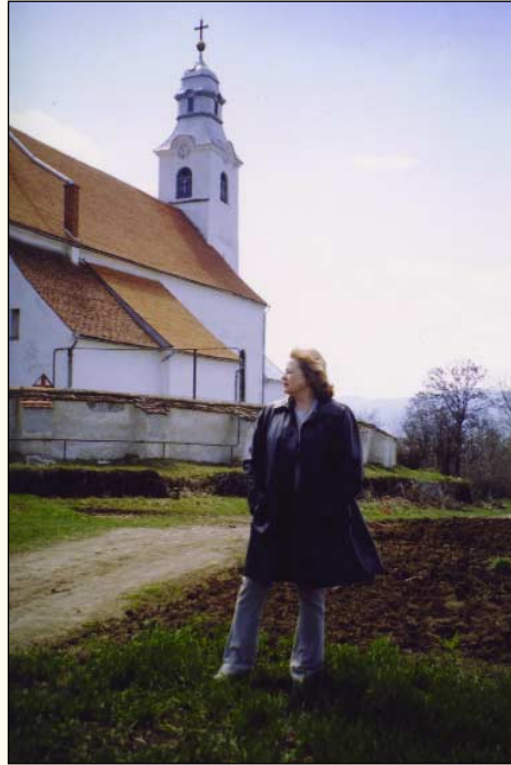
Az alkotó az „ítéletek földjén”

- A korabeli magyar politika miként reagált ezekre az eseményekre?