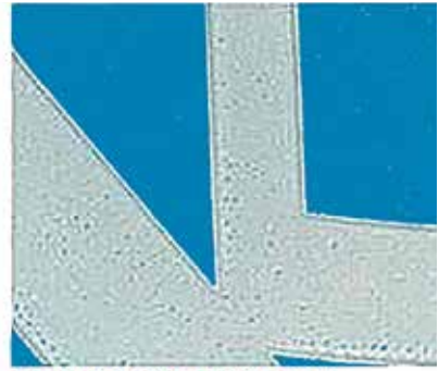
Softer foam from competition

zelése vagy a fizikai felülete nem rendellenes, egyenetlen vagy szennyezett; ellenőrizze a mérőrendszert; ellenőrizze az alkalmazott oldószer összetételét!