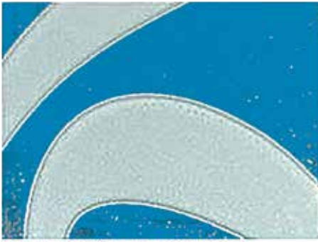
tesa Softprint® Green (hard) foam