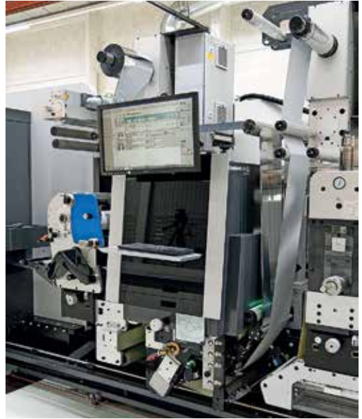
A Steinemann DPE Digital Embellishment Unit-ja (DEU), beépítve egy Gallus Labelfire 340-be

Egy Gallus Labelfire gépsoron belül a modul lehetővé teszi az egyetlen műveletben történő felületnemesítést és nyomtatást teljesen digitális munkamenetben, és közvetlenül a digitális vagy hagyományos nyomóművek után van felszerelve.