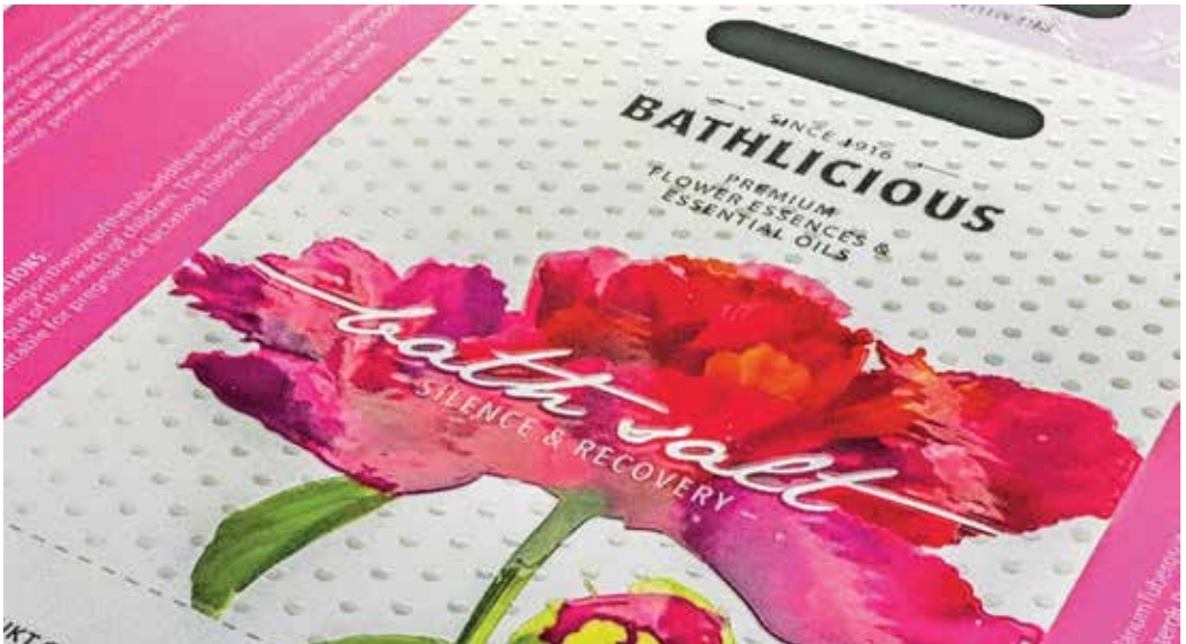
„Bathlicious” fürdőszó hajlított doboza UV-inkjettel nyomtatva. A digitális felületnemesítés inline történt a DEU egységben 32 g/m 2 fényes UV-lakkal