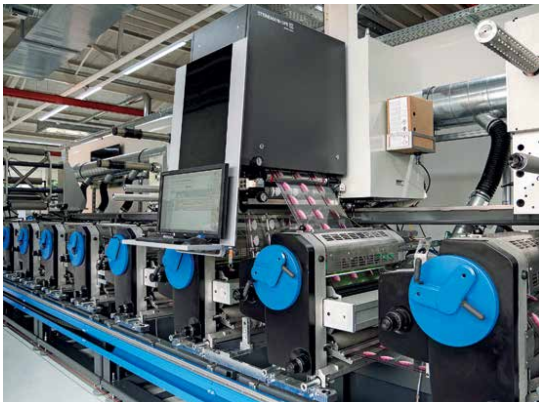
A Steinemann DPE Digital Printbar „White Edition”-ja, beépítve egy Gallus Labelmaster 440-be