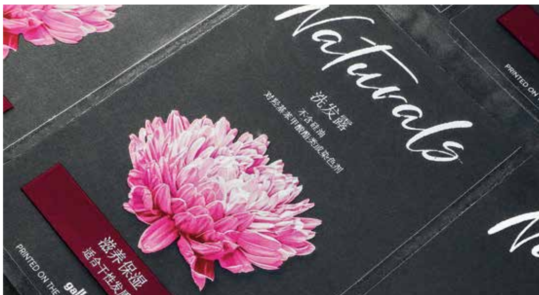
A „Naturals” címkénél a regionális szövegváltozatok nyomtatása a Digital Printbar-ral történik

séges egy szitanyomóműves Gallus Labelmaster beigazításához. A döntő költségelőny-tényező a Digital Printbar esetében a beigazítási selejt megta- karítása, mivel csupán 160 folyóméter (120 + 4 × 10