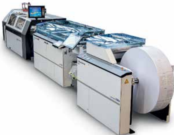
Meccanotecnica Universe Web

A Universe Web az íves verzióhoz hasonlóan egy automata cérnafűző gép, mely digitálisan nyomott anyagok tekercsről feldolgozását teszi lehetővé. Az új Universe Web a letekeresési és vágási folyamatot integrálja, ezáltal kis- és közepes