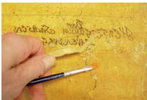
Szakadás javítása japánpapírral

Állományvédelmi szempontból a restaurátor és az adatmentést végző informatikai (digitálizáló, mikrofilmmező, szkennelő, fényképező stb.) műhely (osztály, részleg, labor stb.) tevékenysége