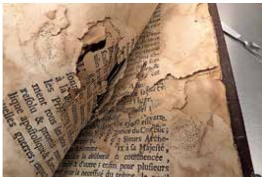
Összetapadt penészes lapok szétválasztása

üzemekben, ott is restaurátorok kutatásaira és szakmai kontrolljára épül a termelés.