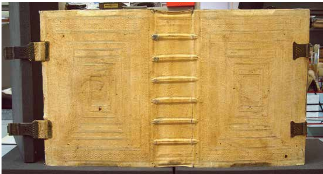
Sertésbőr borítású, fatáblás kötés vaknyomásos díszítéssel, XVI. sz.

A restaurátor képes egy sérült íráshordozó vagy papír alapú tárgy szakserű, a lehető legkisebb beavatkozással járó, szükséges mértékű lebontására és a sérülés típusának és jellegének elemzésére. A károsodásokat okozó fizikai és kémiai folyamatokat felismeri, és kezeli. Egy-egy tárgy eredeti helyreállítása egyúttal fizikai és kémiai állapotának vizsgálata, elemzése, mintavétel, ismeretszerzés, kutatás és a tárgy eredeti jellegének és funkciójának visszaadása a restaurátor etika betartásával. Az eredményeket, megszerzett ismereteket, következtetéseket és a szükséges beavatkozások módját, anyagait rögzíti a dokumentációban, és lehetőség szerint publikálja a szakmai fórumokon. Munkája során olyan könyv-, kötés-, technika- és művészettörténeti információkhoz jut hozzá és adhat tovább, amelyek pl. a kötéselemek lebontása nélkül soha nem kerülnének nyilvánosságra.