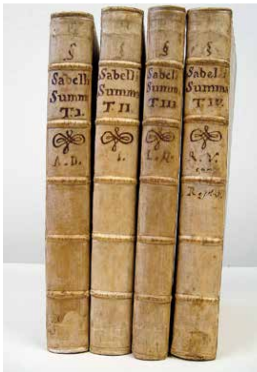
Restaurált feszthátas pergamenkötések, XVII. sz.

A gyakorlati restaurálási tevékenység sorrendje: