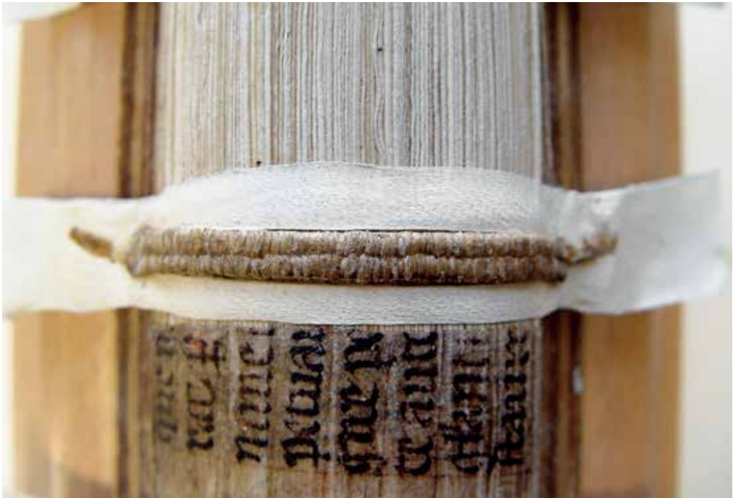
Sérült borda megerősítése bőrcsíkkal