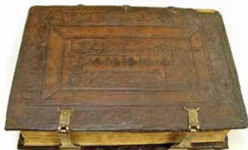
Sérült, fatáblás, vaknyomásos bőrkötés restaurálás előtt és restaurálás után, XVII. sz.