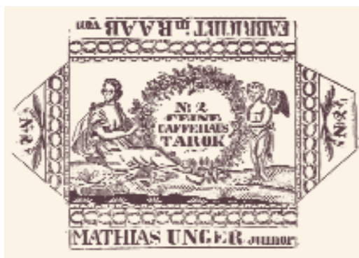
1. ábra. Soproni-képes kártya nyomódúcának próbanyomata. (A győri Xantus János Múzeum tulajdona)

évig egymástól különválva dolgoztak? Az ismert adatok valószínűsítik, hogy az idősebb Unger kb. 1820–1835 között dolgozott, a fia pedig 1835–1850 között művelte ezt a szakmát. Tevékenységükre jellemző, hogy fametszetről sokszorosították a kártyaképeket, bár más szakmabeliek ekkor már szívesebben alkalmaztak rézmetszeteket.