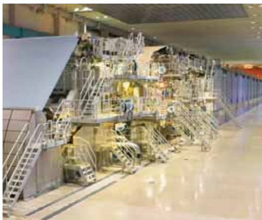
A kép a Stora Enso egyik gyárában készült

A jó hír az, hogy a hazai papírellátást az Európában is meghatározó öt kereskedő leányvállalatai biztosítják, tehát ebből a szempontból mindezen problémák és kapacitási gondok orvoslása ugyanolyan erővel és ugyanolyan górcső alatt történik, mintha egy német vagy egy egyesült királysági piacról beszélünk. Az egyesület tagjai mindent megtesznek, és kötelességüknek tekintik, hogy a hazai papírszakmát és a nyomdászatot ezen körülményekről a lehető leghamarabb informálják, és megpróbálják biztosítani, hogy a kapacitásgondok, áremelési tendenciák és helyzetek ugyanolyan flottul, de a hazai piac igényeit is figyelembe véve történjenek, azok sajátosságait szem előtt tartva próbáljanak megoldást találni a piac és a szakma továbbfejlődése, valamint jövőbeni sikeressége érdekében.