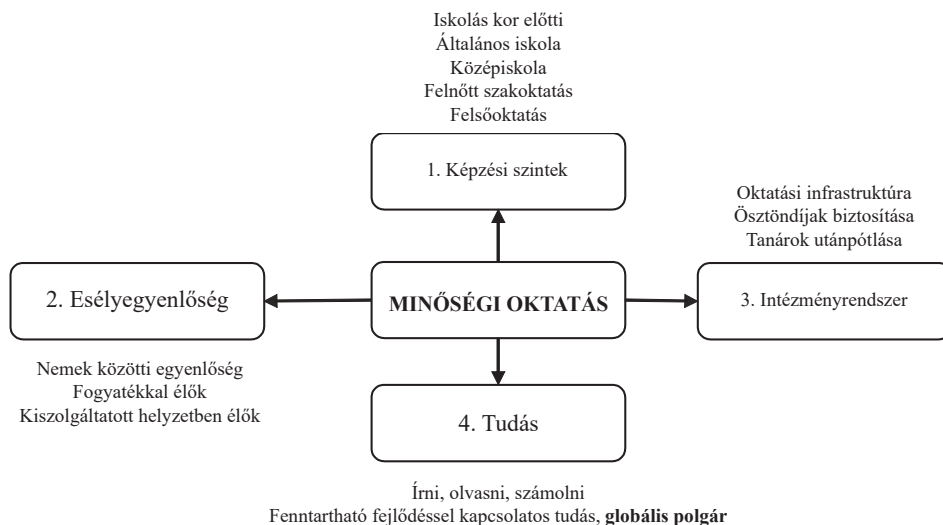
1. ábra. A minőségi oktatás aspektusai az SDG4 alapján (a szerzők saját szerkesztése)

Az ENSZ 2015-ben fogadta el a 2016–2030 közötti időszak fejlesztési irányait meghatározó fenntartható fejlődési célokat (SDG). A 17 cél globális együttműködésbe ágyazva lefedi a fenntartható fejlődés három pillérét: társadalmi, gazdasági és környezeti területeket foglalnak magukban (Jong–Vijge, 2021). Az SDG-k elérése érdekében a globális polgároknak is kiemelt szerepük van, és az embereknek viselkedésükben, hozzáállásukban kell megváltozniuk, hogy fenntartható életmódot alakítsanak ki (Guan et al., 2019; Yamane–Kaneko, 2021a, 2021b). A fiatal generáció lehetne az igazi mozgatórugó az SDG-k megvalósításában (Yamane–Kaneko, 2021b), így az egyetemeken fontos szerepet játszanak az SDG-k iránti tudatosság növelésében (Filho et al., 2019; Manolis–Manoli, 2021).