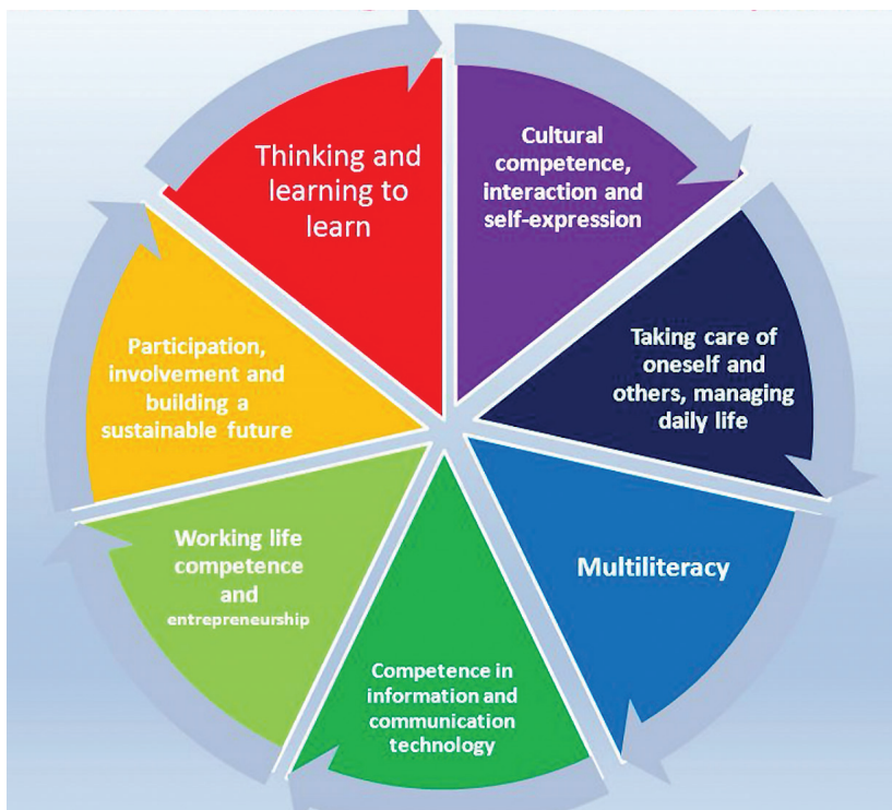
1. ábra. A keresztkompetenciák (Finnish National Agency for Education) (Az ábra szövege megegyezik a fentebbi felsorolásával.)