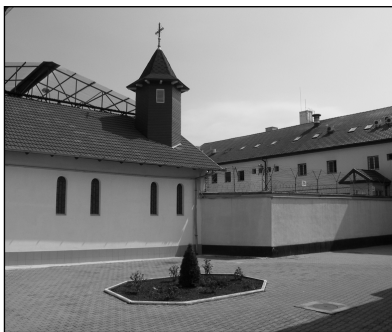
A marosvásárhelyi börtön udvara

Azért tervezte Marosvásárhelyre, a város szélére ezt a börtönt, mert marosvásárhelyi, ezt a várost ismeri a legjobban, és mert a diplomamunkához a pontos helyszínt is meg kellett jelölni, oda kellett megtervezni az intézményt. Tervét országos szinten sem ajánlotta még fel sem a belügyminisztériumnak, sem az országos börtönfelügyelőségnek. Reménykedjünk abban, hogy ami késik, nem múlik. Vagyis abban, hogy a nem túl távoli jövőben a bűntettek elkövetőit emberszámba vevő, a későbbi társadalmi beilleszkedést jól szolgáló börtönök működnek majd Romániában (is).