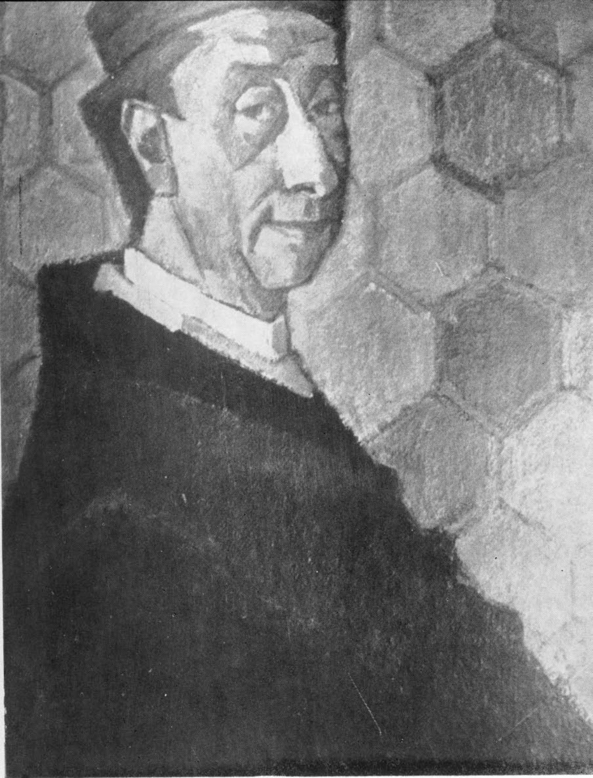
MOHI SANDOR: CINQUECENTO