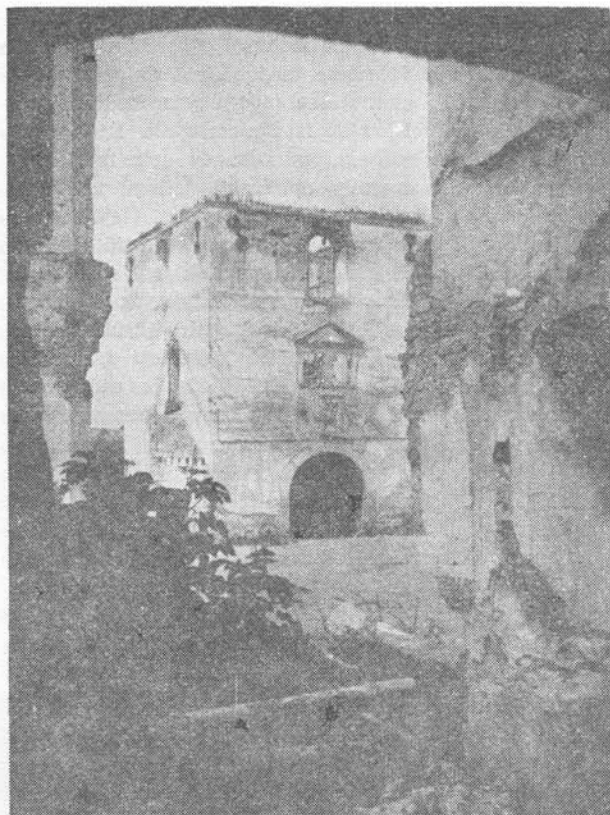
A szentbenedeki Kornis-kastély

inkább elszigetelődő Erdélyben a Kolozsváron kialakuló kőfaragó-iskola mesterei válnak a stílus továbbfejlesztőivé. Így jött létre ez az olasz—lombard szellemiségben fogant, de már külön védőrendszerrel ellátott, mozgalmas tömegei festői elrendezésével, helyi jelleggel megépített, árokkal övezett, láncos felvonóhidas, védelmi várkastély is. A bizonytalanságban élők minden irányú védekezésre való berendezkedésével, zömök, vaskos épületei távol állnak az arányok klasszikus megkötöttségétől. Belül a népi elemek fantáziával történt ötvöződéséből formálódott gazdag részletkialakítása.