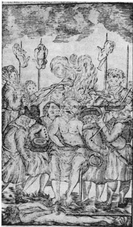
Korabeli metszet Taurinus könyvéből