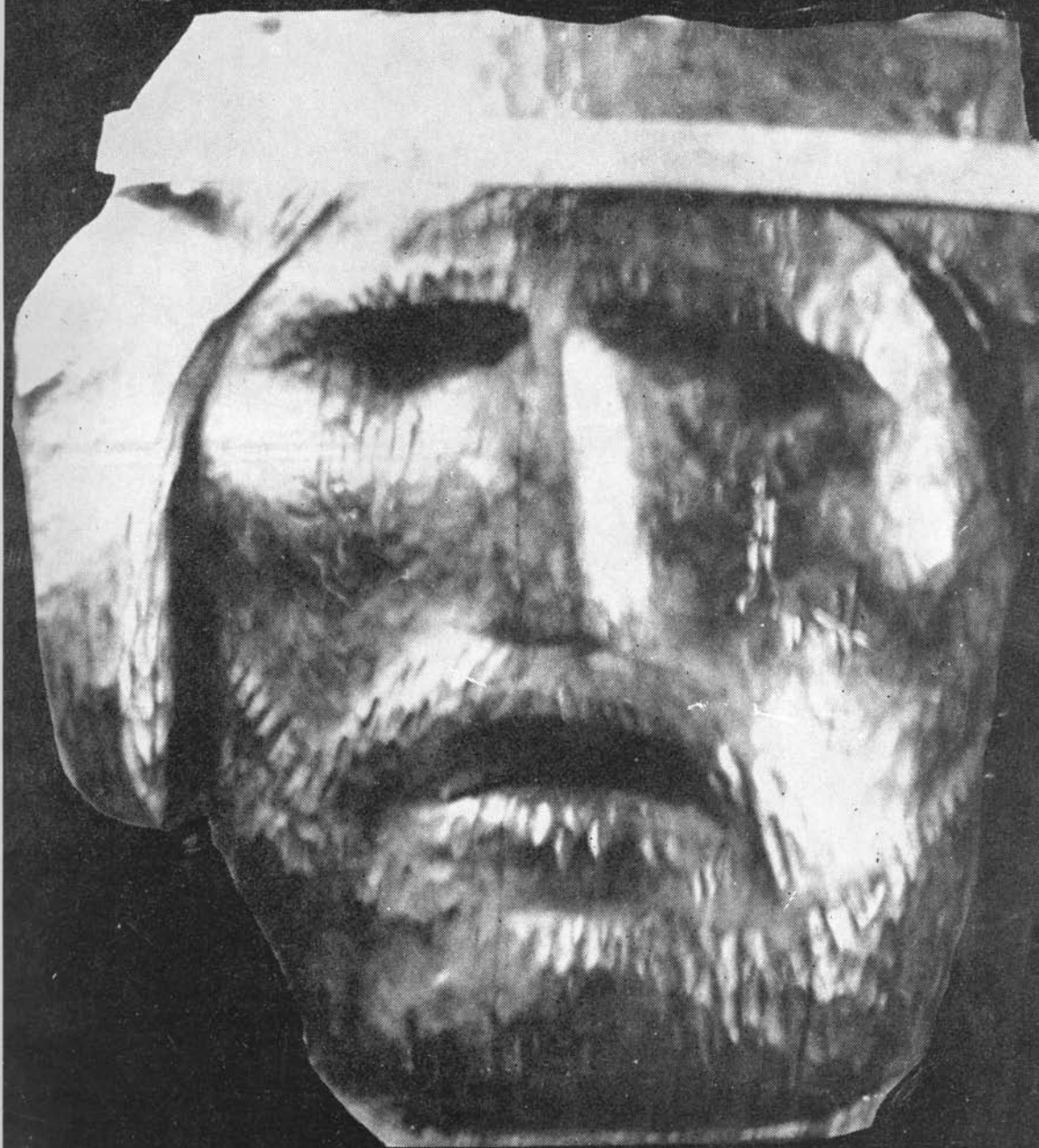
SZERVÁTIUSZ TIBOR: Dózsa György (1963)