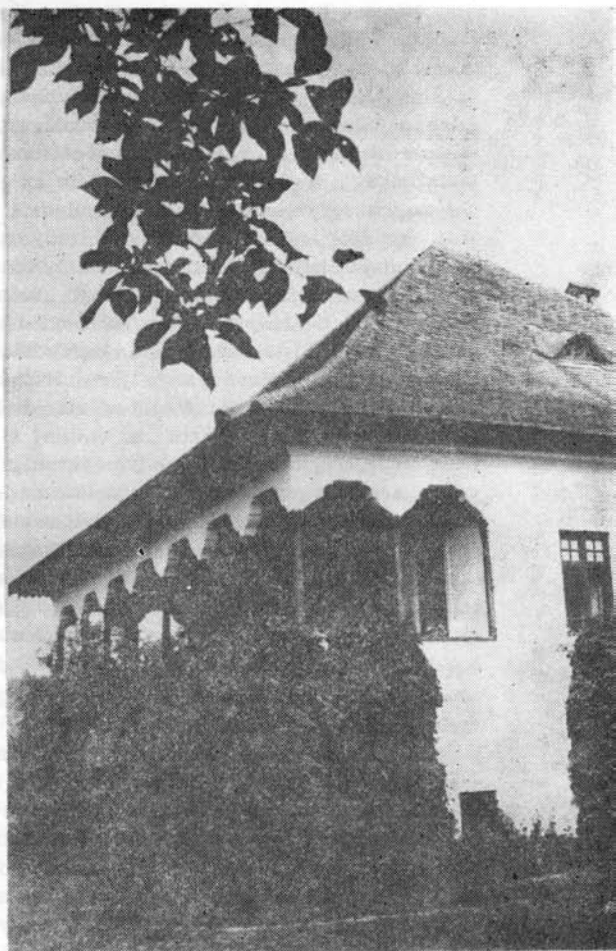
Nicolae Iorga Vălenii de Munte-i háza

Nicolae Iorga utolsó nagylélegzetű munkája az Istoria Românilor (A románok története) volt. Ebben a hatalmas, tízkötetes műben a nagy történész egy életen át felhalmozott ismereteit, tapasztalatait összegezte, s kifejeződött benne az a rendkívüli képessége, hogy a haza történetének tükrében mutassa be a világtörténelmet. Rendszeresen arra törekedett, hogy a román nép múltját az egész emberiség történelmének keretei közé helyezze, s ezért 1935—1936-ban megírta a háromkötetes La place des Roumains dans l'histoire universelle (A románok helye az egyetemes történelemben) című munkáját.