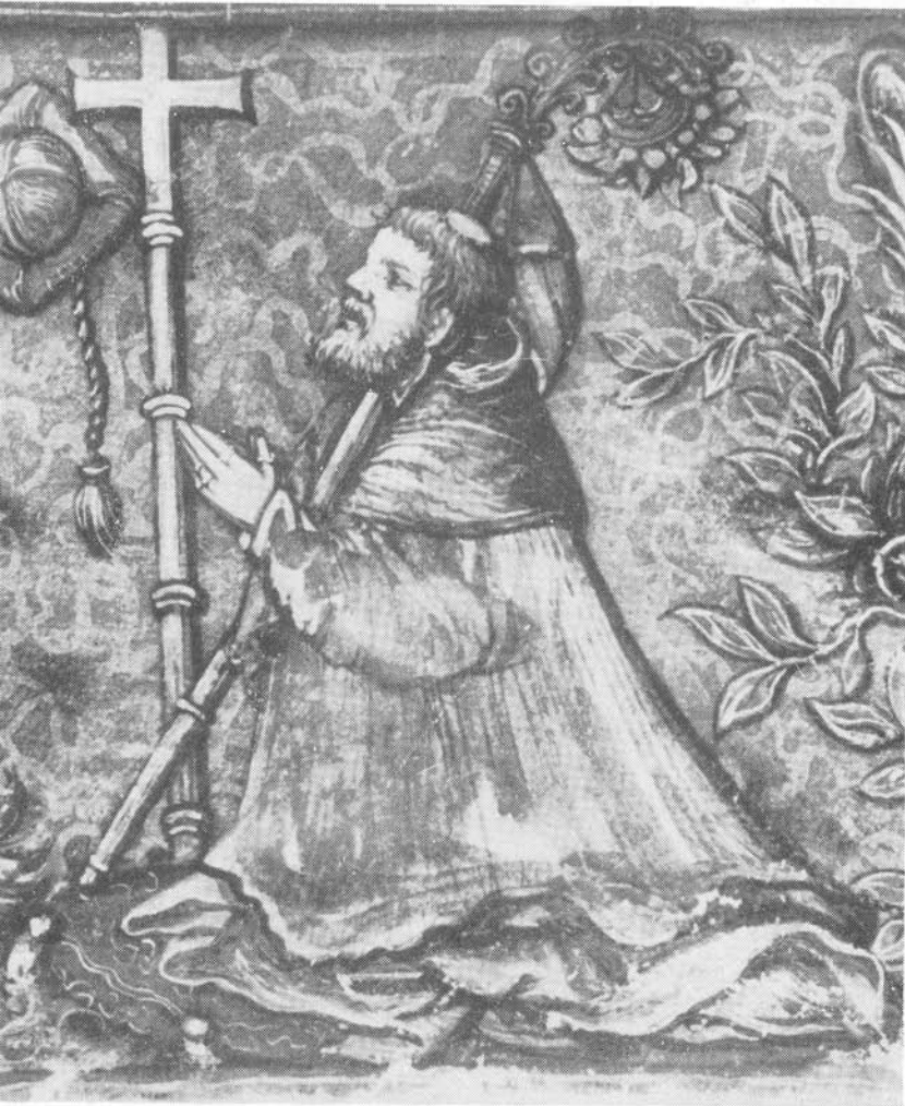
1. Nicolaus Olahus címereslevelének első oldala Bocskay György kezeírásában.