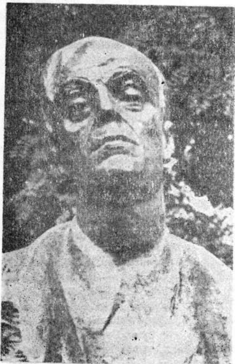
Romul Ladea: Liviu Rebreanu (szobor-részlet)

A realitás kényszerében öntudatra ébredő Bologa korántsincs egyedül. Az író tisztán látja, hogy a háború, amely milliós tömegeket ragadott magával, milliókban