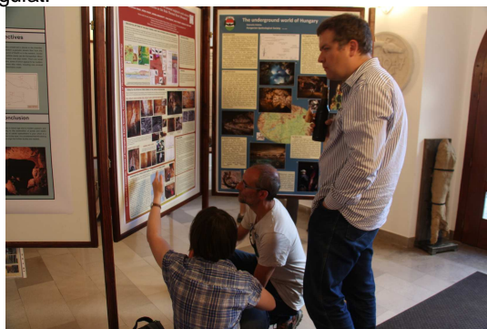
Magyar poszter bemutatása az érdeklődőknek

A terepi utazások során bejártuk többek között a környék forrásait, az ikonikus Skocjan-barlangot, az egykori felső fosszil alig-alig észlelhető romjaival együtt, és természetesen a Postojnai-barlangot is. Mint minden évben, az utolsó napi túra a Ljubljanica-folyó vízgyűjtő területét, a forrásokat, nyelőket, poljékat és a Rakov Skocjant járta körbe.