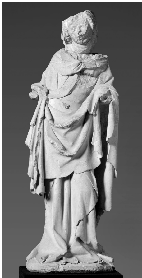
2. kép. Madonna szobor a gótikus szoborleletből, 15. század (Budapest Történelmi Múzeum,)