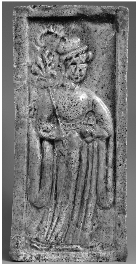
1. kép. Borbála királyné alakja kályhacsem- pén, 15. század (Budapest Történelmi Múzeum, Tihanyi Bence felvétele)

Az udvarhölgyekre vonatkozóan némi információhoz éppen Habsburg Mária udvartartása kapcsán juthatunk, mivel az ő házassága előtti és megözvegyülése utáni udvari rendtartások 11 fennmaradtak. Az 1516–1518-as innsbrucki, valamint az 1534–1558 között készült binche-i listák nagyjából egyforma képet mutatnak. A főhercegnői és a régensi udvar 15–20 nóból állt, akiknek vezetője az udvarmesternő volt, őt követték az udvarhölgyek és a kamaráshölgyek, majd a rangsor végén a szolgáló asszonyok és lányok álltak. Ha az élethelyzet megkívánta, akkor bába, dajka és nevelőnő is a csoport részét képezte. Ez utóbbiak, valamint a szolgálók és a mosónők munkájára később még visszatérünk.