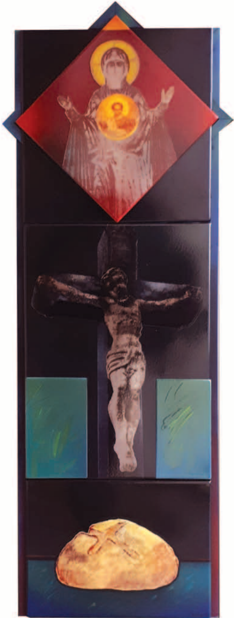
BALANYI KÁROLY, Az örök élet kenyere III.