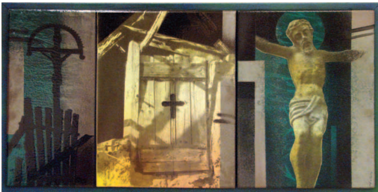
BALANYI KÁROLY, Inkulturáció