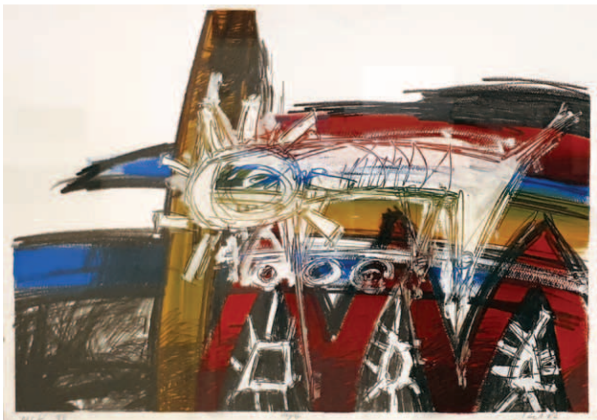
RAGÓ LÓRÁNT, MCK XIII.