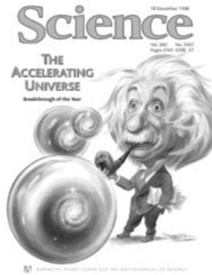
3. ábra. „Az év tudományos áttörése” a Science folyóirat címlapján (1998. december).

A két csillagászcsoporthoz tartozó eredményei nagy visszhangot váltottak ki szakmai és egyéb körökben is. Több szakfolyóirat és tudományos szervezet is az évtized – sőt, az évszázad – legnagyobb felfedezései közé sorolta a Világegyetem gyorsuló tágulásának kimutatását (3. ábra). A szaknyelvben gyorsan meghonosodott a sötét energia elnevezés, amelyet a gravitációval ellentétesen viselkedő, de teljesen ismeretlen hatásnak adtak. A fejleményeknek köszönhetően újra értelmezhetővé vált a kozmológiai állandó Einstein által megalkotott fogalma is, csak nem a statikus, hanem a gyorsulva táguló Univerzum legfontosabb paramétereként.